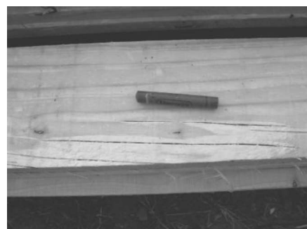
Fotos 1 y 2: Rajaduras radiales en el 4 to anillo de crecimiento en ejemplar de Pinus taeda en rodal DC11 y tabla afectada por las mismas.

Photography 1 and 2: Radial splits in the 4 th growth ring in a tree of Pinus taeda in the stand DC11 and lumber affected by splitting