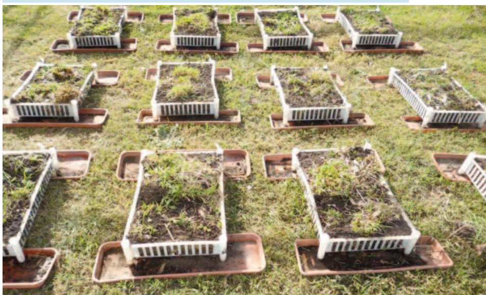
Figura 2 | Plántulas/microcosmos (media \pm EE) obtenidas para los distintos tratamientos.