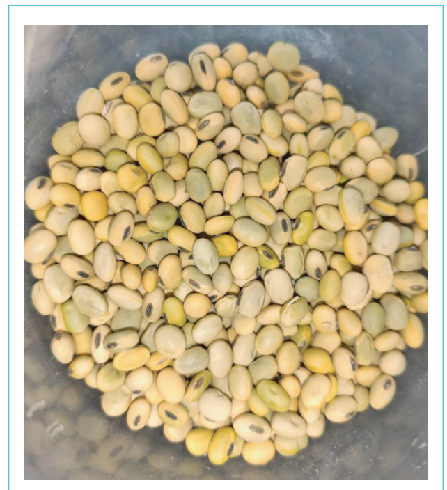
Foto 1. Muestra de soja con presencia de semillas verdes de diversas tonalidades