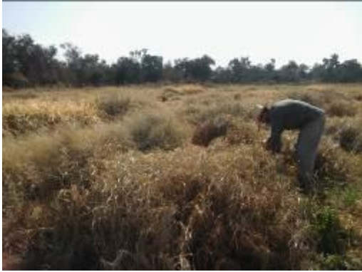
Figura 5. Evaluación de daños por heladas