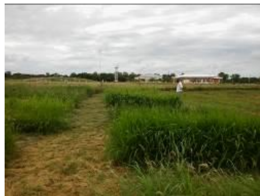
Figura 3 y 4. Microparcels de pasturas megatérmicas