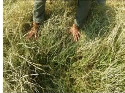
Figura 6. Evaluación de daños por heladas en Chloris gayana cv finecut