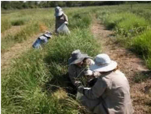
Figura 7. Cortes para determinación de productividad