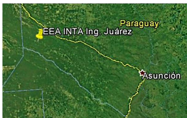
Figura 1. Ubicación del ensayo.

El ensayo se realizó en la Estación Experimental del INTA en Ing. G. N. Juárez en el kilómetro 1618,7 de RN° 81, localizada en el departamento Bermejo de la provincia de Formosa. Latitud: 23°56'43.43"S, Longitud: 61°45'19.08"O (Figura.1). El área posee un clima subtropical continental semiárido con época seca definida, la precipitación media anual es de 650 mm concentrando el 80 % en los meses de noviembre a abril. Su temperatura media anual es de 23°C con máximas que superan los 47°C y mínimas de -5°C en invierno. La evapotranspiración potencial media anual es superior a 1300 mm (según método de Thornthwaite) lo que provoca un balance hídrico negativo a lo largo de todo el año.