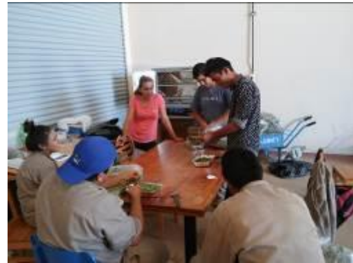
Figura 8. Acondicionamiento de muestras para secado en estufa