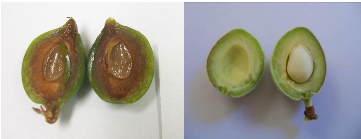
Foto N° 3. Izquierda: fruto de nectarino [ Prunus persica (L.) Batsch.] dañado por la helada. Derecha: fruto de almendro sin daño. Ambas especies tienen frutos similares e igual sintomatología de daño por helada en frutos pequeños.

5. La evaluación del daño por heladas en frutos pequeños se realizará con igual metodología que con las flores (Foto N°3), incluyendo un registro fotográfico.