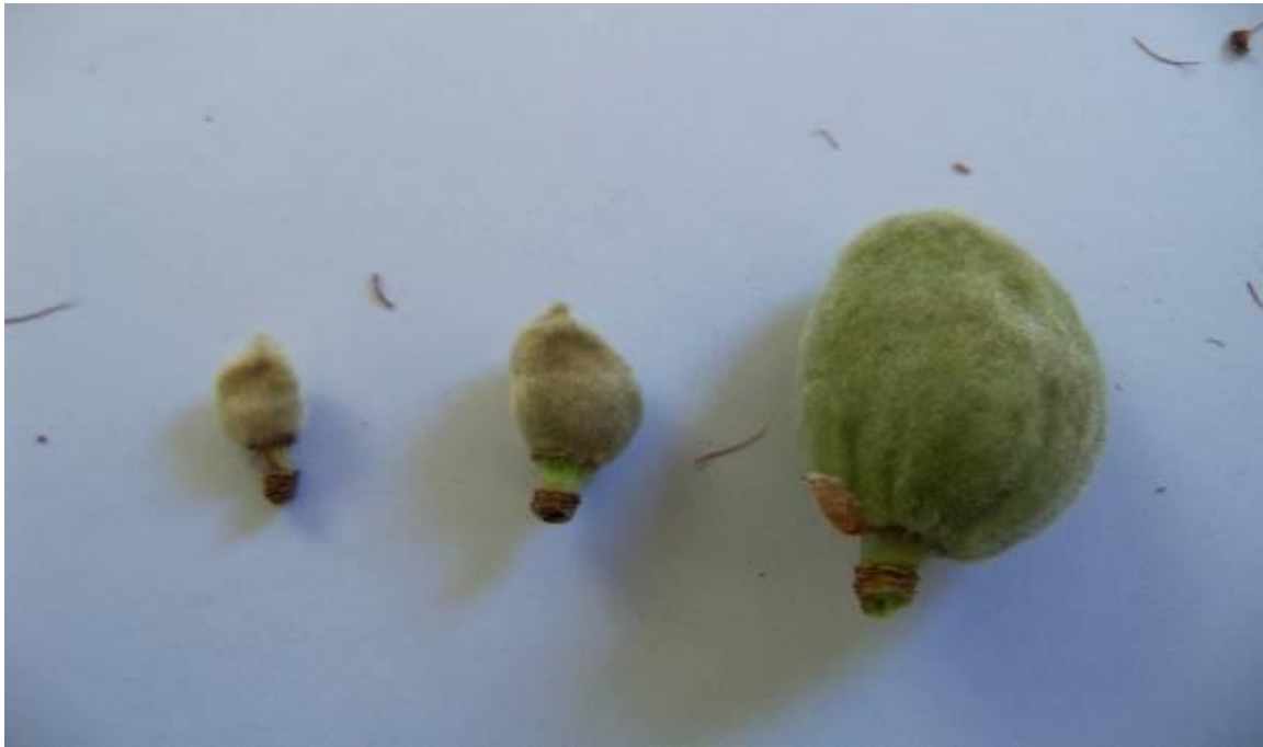
Foto N° 4. Frutos jóvenes de almendro dañados por heladas (izquierda y centro), en comparación con uno sano (derecha).

7. En el mes de octubre se realizará un nuevo conteo de frutos de las ramas marcadas, se determinará nuevamente densidad de frutos y porcentaje de cuaje ( n^{\circ} de frutos cuajados / n^{\circ} de flores x 100). Si bien el porcentaje de cuaje obtenido depende de factores externos (climáticos) e internos del árbol (fisiológicos o nutricionales) que pueden provocar una caída adicional de pequeños frutos, estos valores se pueden relacionar para su análisis con las variables climáticas presentadas durante los meses de agosto y septiembre.