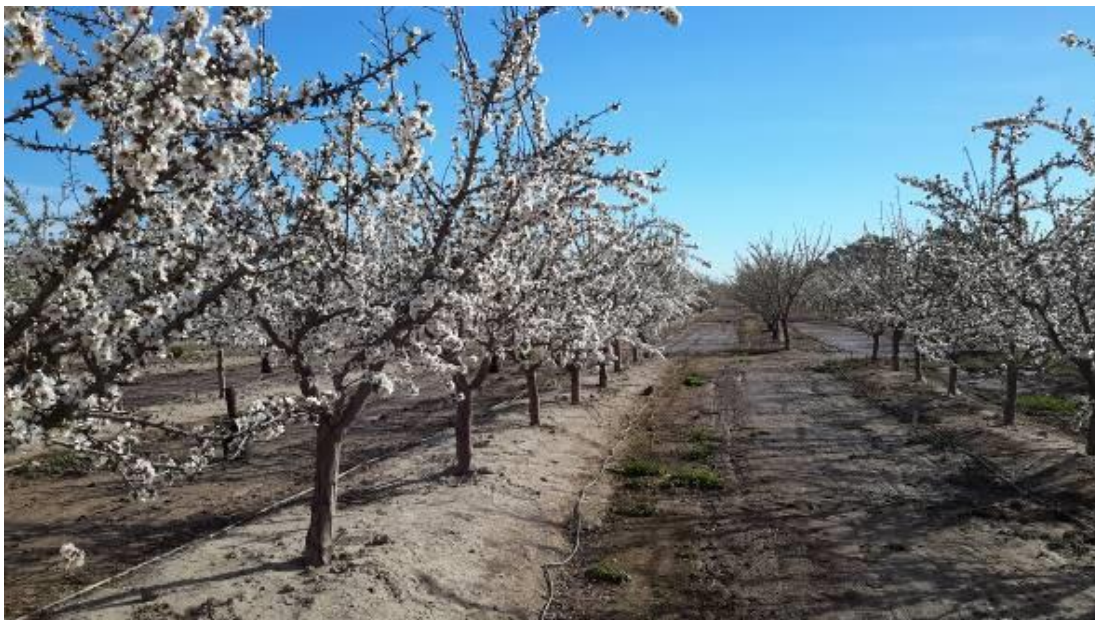
Foto N° 6. Variedad Guara en la fase fenológica de Fin de Plena Floración (FPF)