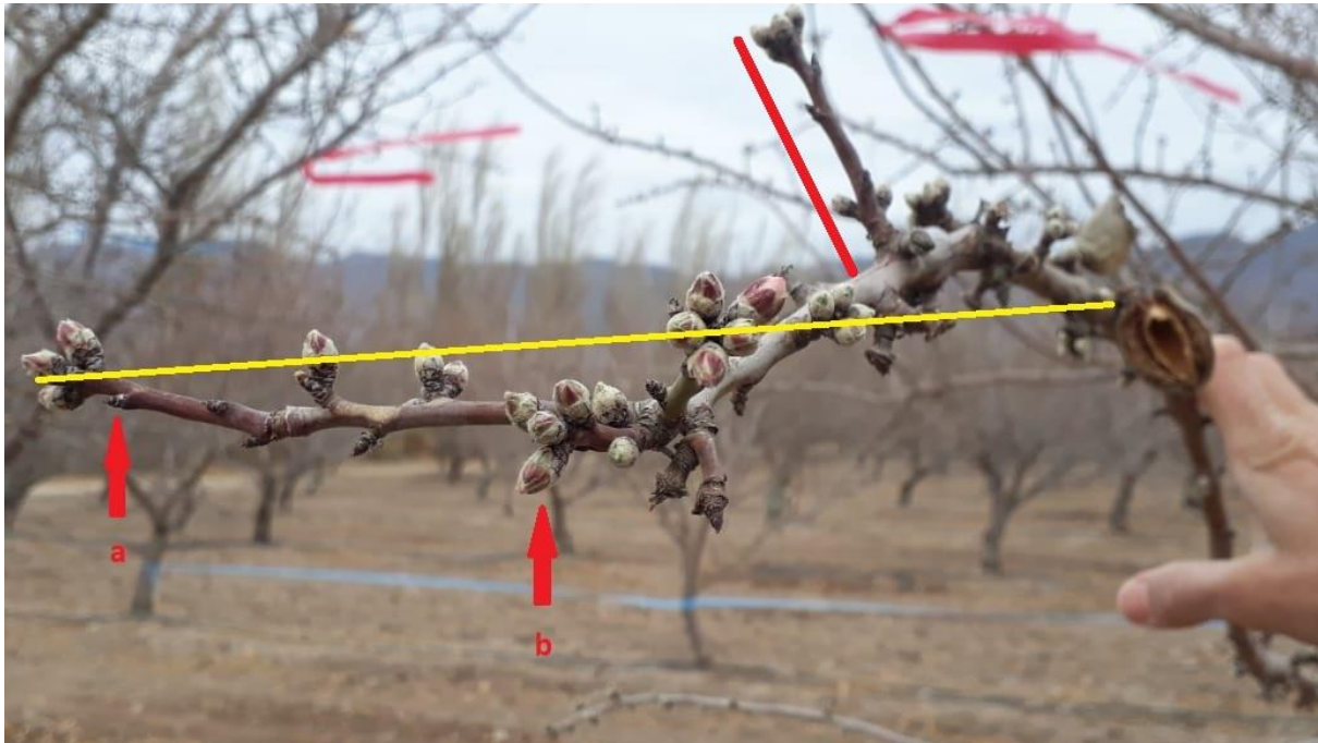
Foto N°1. Rama de almendro con brindillas y ramilletes, observándose yemas de madera puntiagudas (a) y yemas de flor globosas (b). La línea amarilla corresponde a la longitud de rama, mientras que la línea roja a la longitud de una brindilla.

flor, las cuales se caracterizan por ser globosas y de mayor tamaño, mientras que las yemas de madera son puntiagudas y determinar la densidad de floración (número total de yemas de flor/ longitud de rama). Para el cálculo, a la longitud de rama debe sumarse la longitud de las brindillas; esto es debido al hábito de fructificación del almendro en ramilletes y brindillas (Foto N°1). El conteo de yemas se realiza desde la base hacia el ápice de la rama, facilitándose esta tarea mediante la utilización de un contador.