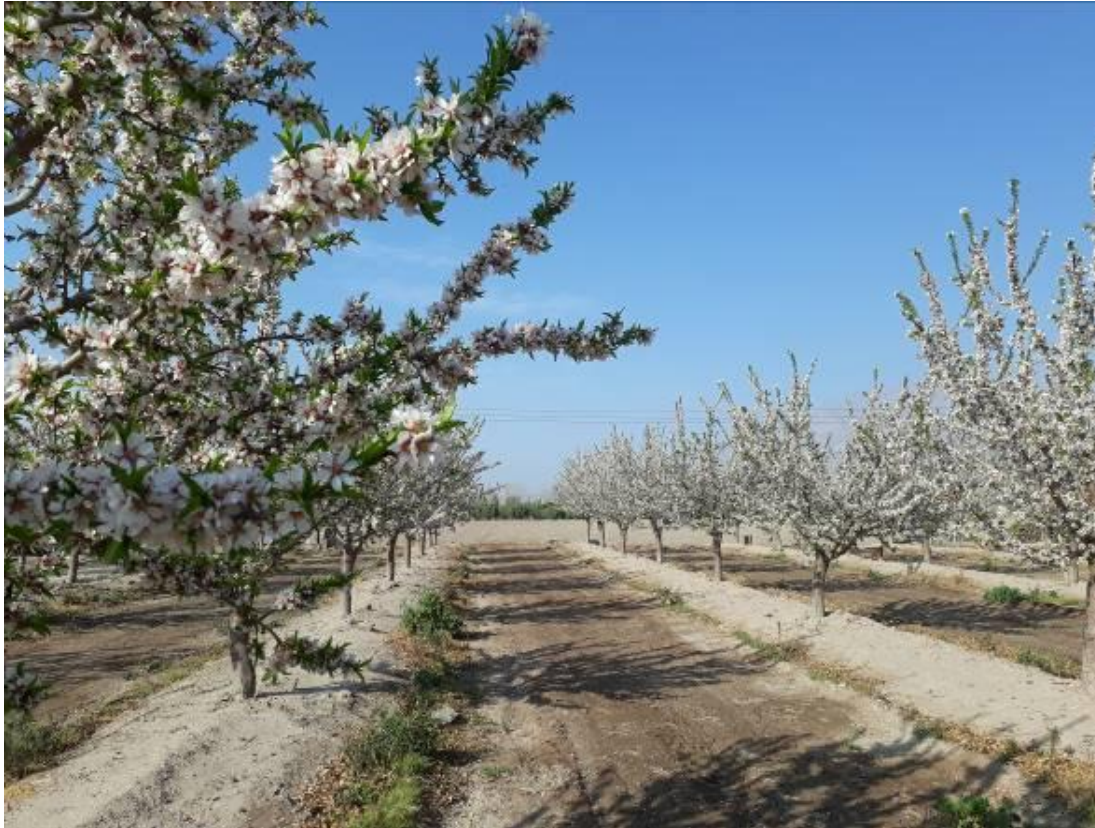
Foto N° 5. Variedad Marinada en la fase fenológica de Inicio de caída de pétalos (ICP)

observaciones se realizará cada dos o tres días. Se adjunta planilla de registro de variables fenológicas.