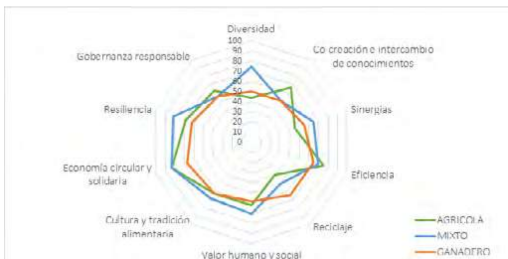
Figura 1. Mediana de los promedios para los 10 elementos de la agroecología por tipo de producción predominante.