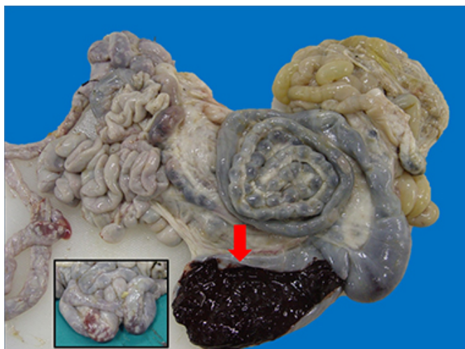
Figura 3. Intestino delgado y grueso. Obsérvese el color oscuro y la consistencia pastosa del contenido cecal (flecha). Los nódulos blanquecinos y la hemorragia en íleon se aprecian desde la serosa (recuadro).

de 13,9 \times 10^5 ooquistes. En el cultivo del contenido cecal, se evidenciaron dos clases de ooquistes: 1) elipsoidales de 32 \times 22 \mu\text{m} de tamaño, con cápsula polar, micrópilo y color de la pared marrón-amarillento clasificados como Eimeria arloingi en un 90% del conteo; 2) subesféricos de 24 \times 20 \mu\text{m} de tamaño, sin cápsula polar, con micrópilo y color de la pared marrón-verdoso identificados como Eimeria ninakohlyakimovae en un 10% del conteo.