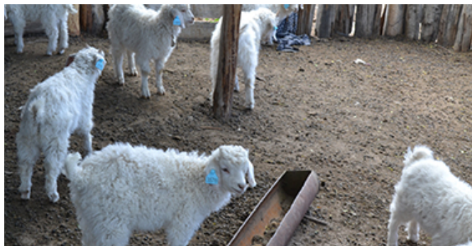
Figura 1. Cabritos en el cobertizo donde ocurrió el brote. Obsérvese la escasa dimensión, la falta de limpieza y la ausencia de signos de diarrea en el suelo y en los cabritos.

En el momento de la inspección se observó un cabrito en estado agónico que estaba en decúbito lateral, con extrema debilidad, espuma en la boca, extremos de los miembros hipotérmicos y marcada palidez de las mucosas. En la revisión clínica tanto las madres como el resto de los cabritos se encontraban alertas y vigorosos, sin signos de diarrea, anorexia o debilidad (Figura 1).