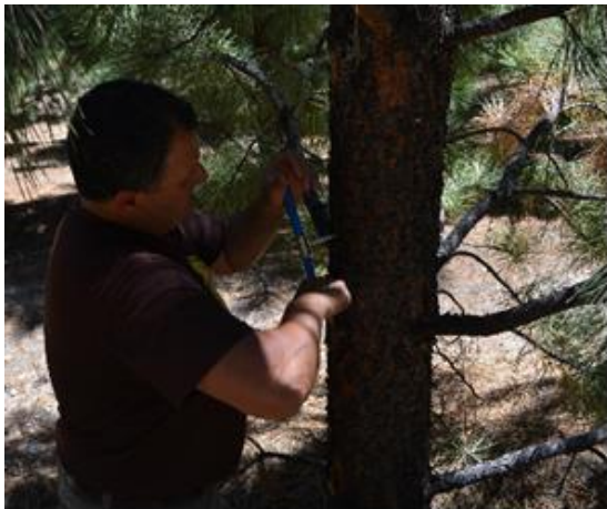
Foto 1a. Extracción de tarugo de madera para cálculo de densidad en verde

calidades de sitios, edades y manejo silvícola. En todos los árboles de cada parcela se midió la velocidad de propagación de onda acústica ( V , Foto 1b) sobre el fuste de cada árbol y se extrajo un tarugo de madera para determinar la densidad en verde de la madera ( \rho_{\text{verde}} , Foto 1a).