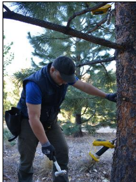
Foto 1b. Medición de velocidad de propagación de onda acústica sobre el fuste con equipo portátil ST300 (Fibre-Gen, NZ).

Con el dato de velocidad de propagación de onda y de densidad en verde, se calculó para cada árbol el MOE, en este caso denominado módulo de elasticidad dinámico ( MOE_d = V^2 \cdot \rho_{\text{verde}} ). La unidad de medida del MOE_d es GPa. En cada árbol también se midió el diámetro a la altura del pecho (DAP), su altura total ( H ) y se calculó su esbeltez ( S ) a partir de la relación entre la altura y el diámetro ( H/DAP ). A nivel de rodal, se calculó la altura dominante ( H_{100} ), el índice del sitio a una edad base de 20 años ( IS_{20} ) y se estableció para cada árbol un parámetro de posición sociológica que se denominó altura relativa ( HR ) que surge de la relación entre la altura de cada árbol y la altura dominante del rodal ( HR = H / H_{100} ).