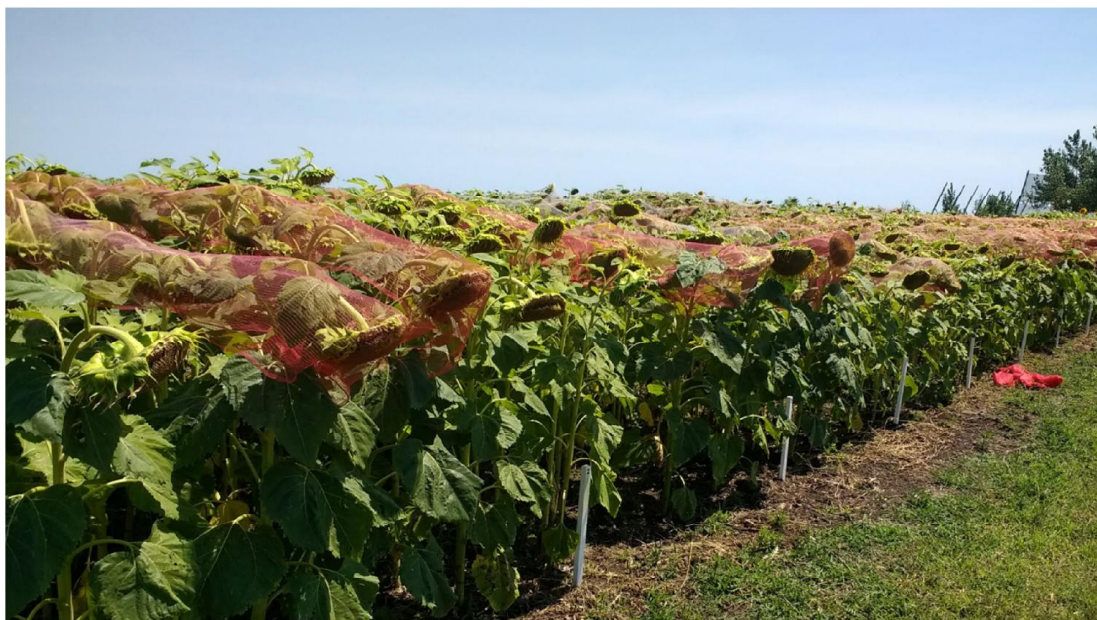
Vista parcial del ensayo de girasol en el Campo Experimental Domingo y María Barnetche de Bolívar.

http://datosestimaciones.magyp.gob.ar/reportes.php?reporte=Estimaciones