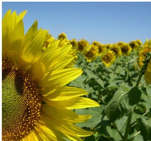
Híbrido de girasol en ensayo experimental

Los porcentajes medios de aceite fueron elevados: 52% en Bolívar, 51% en Bellocq y 49% en Tejedor. Los rangos estuvieron entre 56% y 46%, superando ampliamente la base de bonificación de 42%. Esto genera un rendimiento ajustado medio de 3.612 kg ha -1 para Bolívar, 4.112 kg ha -1 para Bellocq y 2.775 kg ha -1 para Tejedor (Tablas 3, 4 y 5).