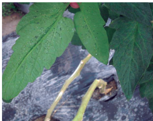
Figura 5. Presencia de pupas negras parasitadas por Encarsia formosa .

para evitar perjudicar a los enemigos naturales liberados. Al mes de la primera liberación se hizo la primera evaluación de la instalación del parasitoide utilizando la técnica de presencia/ausencia de pupas de mosca blanca parasitadas anteriormente explicada.