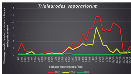
Figura 8. Evolución de adultos de mosca blanca T. vaporariorum por hoja en tomate a lo largo de las campañas 2015-2017.

En la campaña 2015, al momento de liberar el parasitoide, el promedio de adultos de mosca blanca en el invernadero se encontró por debajo del umbral de daño, es decir, 6 adultos/hoja. En el año 2016, si bien se repitió el manejo integrado de plagas, al momento de realizar la suelta del