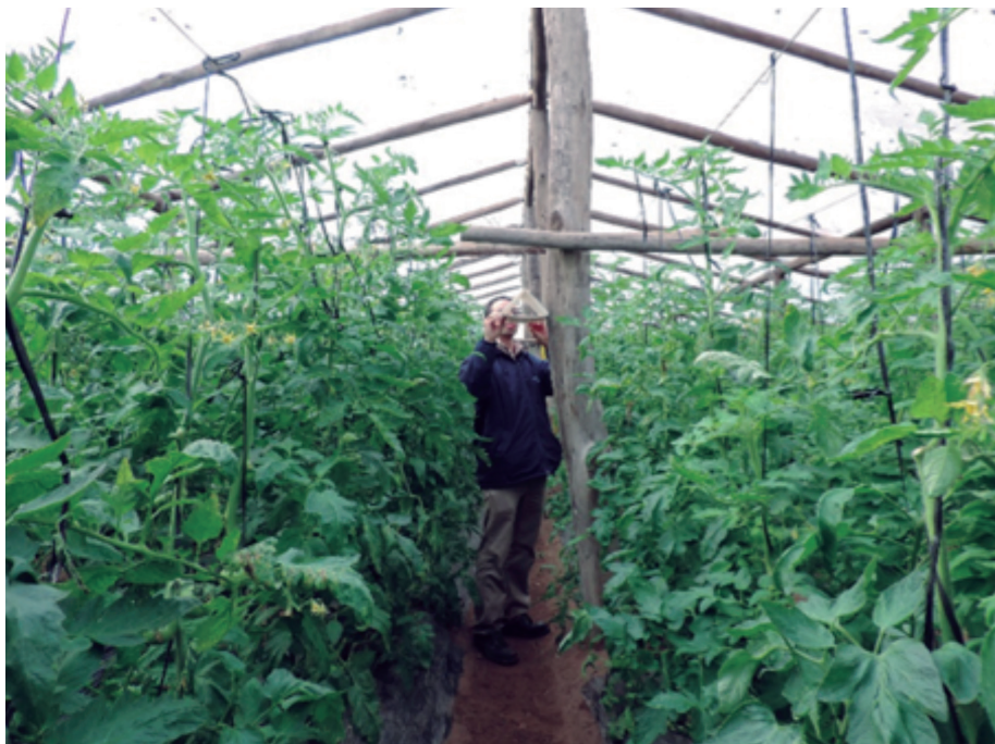
Figura 7. Monitoreo indirecto de la polilla del tomate.

Dentro del cultivo de tomate pueden aparecer otras plagas que se localizan en focos, por ejemplo, la mosca minadora de la hoja Liriomyza spp. y pulgones, cuya especie más observada es Macrosiphum euphorbiae (Thomas). Ambas