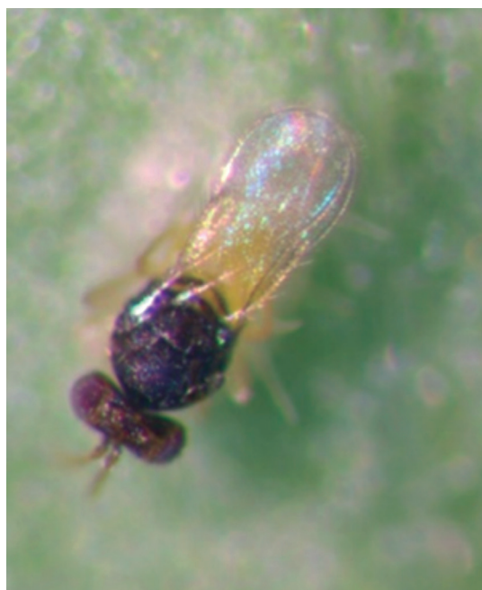
Figura 4. Encarsia formosa parasitando ninfa de mosca blanca.

del registro del nivel de parasitismo de E. formosa en el cultivo (observar la presencia de pupas de mosca blanca negras) (Figuras 4 y 5). Finalmente, se realizaron cuatro liberaciones en total, a razón de 6 pupas por m 2 de E. formosa . Posteriormente, los monitoreos efectuados determinaron si el número de adultos y ninfas se encontraba cerca del umbral de daño, lo cual justificaría realizar –como último recurso de control de la plaga– algún tratamiento con insecticida de síntesis química selectivo o botánico compatible con la fauna auxiliar,