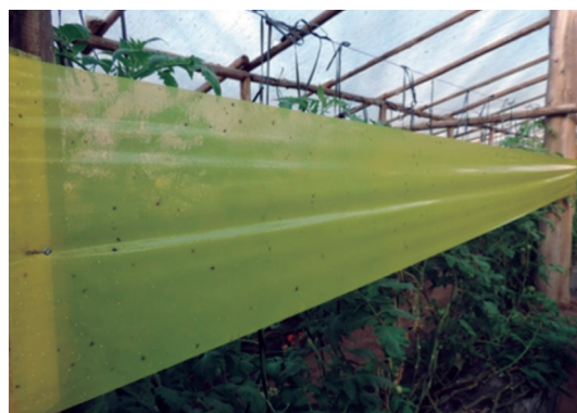
Figura 2. Bandas cromotrópicas adhesivas amarillas en invernadero.