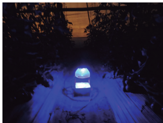
Figura 6. Trampa de luz LED autónoma con panel solar.

Con referencia al monitoreo semanal, se puede detectar rápidamente la presencia del minador de la hoja, Tuta absoluta , en el cultivo. Ello se logra