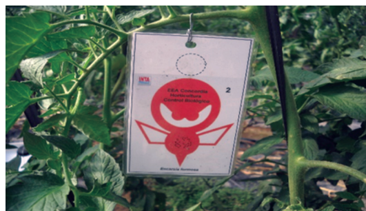
Figura 3. Tarjeta de liberación de Encarsia formosa en invernadero.