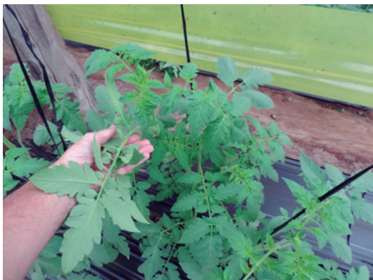
Figura 1. Monitoreo directo de plagas en cultivo de tomate.

En este caso, una manera rápida de evaluar si el control biológico resultaba eficaz era a través