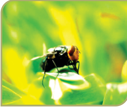
Figura 1. Hembra adulta de Cochliomyia hominivorax sobre vegetación.