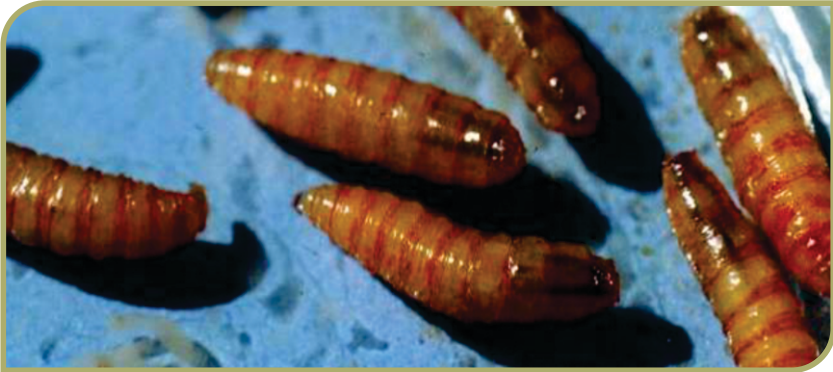
Figura 3. Larvas maduras de Cochliomyia hominivorax de siete días de edad y próximas a pupar.

cópula y la hembra inseminada está lista para depositar su primera masa de huevos y comienza la búsqueda de un hospedador para oviponer. En la naturaleza el tiempo de vida de los adultos es de 14 a 21 días y la dispersión de los mismos en busca de hospedadores puede superar ampliamente los 100 km dentro de una generación.