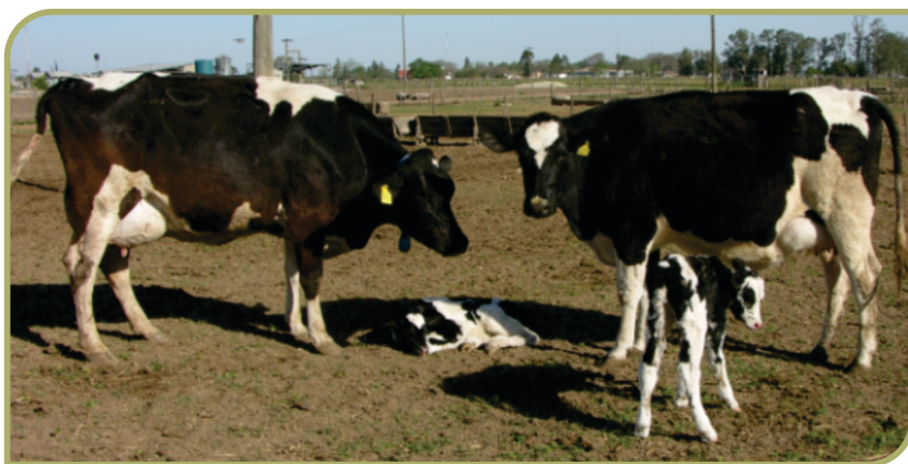
Figura 4. Por su actividad contra las larvas de primer estadio la administración subcutánea de doramectina protege las heridas susceptibles (por ejemplo, umbilicales) por 10 a 12 días. La aplicación de doramectina a terneros en las primeras 24 horas de nacidos es una opción muy práctica, segura y efectiva para prevenir estas miasis.