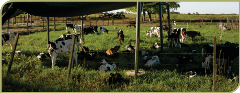
Figura 5. En los sistemas de crianza grupal o bajo condiciones de precipitaciones altas se puede ver limitada seriamente la actividad de insecticidas aplicados en forma local.

La acción sistémica de estos insecticidas muestra ventajas importantes bajo condiciones de frecuentes lluvias (como las que caracterizaron este período de estudio) por lo cual los insecticidas locales suelen ser “lavados” o arrastrados con las precipitaciones. El contacto con el barro y el lamido de los terneros también disminuyen la permanencia y actividad de los insecticidas sobre las heridas y por lo tanto la vía de aplicación es probablemente el motivo de estas fallas más que las diferencias intrínsecas de eficacia insecticida entre las drogas (Figura 5).