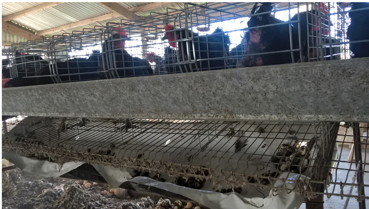
Fotografía 1. Superficie de recolección de excretas

plásticas, se pesó y posteriormente se calculó la cantidad excretada ave/día (Tabla 1). Luego, se dividieron en alícuotas de 100 g en bolsas plásticas de cierre hermético conservándose a 0°C hasta su procesamiento. Además, en tres alícuotas de cada muestreo se determinaron por triplicado: pH, conductividad eléctrica (CE), materia seca (MS), materia orgánica (MO), nitrógeno Kjeldhal; nitrógeno de amonio ( \text{NNH}_4 ) y relación carbono/nitrógeno (C/N) (Tabla 2).