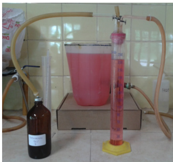
Fotografía 2. Elementos utilizados para medición de gas

La producción diaria de biogás se midió insertando una jeringa en el tapón septum de los frascos y registrando el desplazamiento de un volumen de líquido acidulado, colocado en una probeta de vidrio graduada de 250 mL conectada a un recipiente de plástico a presión atmosférica (Fotografía 2).