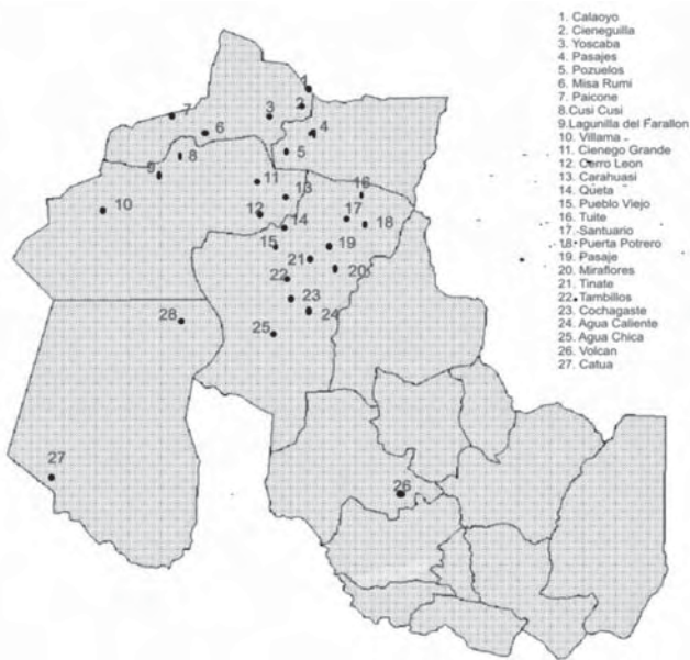
Figura 1 Mapa representativo de la distribución geográfica de los productores ganaderos en la provincia de Jujuy ( 24^{\circ} 01' S - 65^{\circ} 25' O ). Cada punto numerado se corresponde con una localidad citada al margen. (Autorizada su reproducción por Marín R.E. "Prevalencia sanitaria en llamas de la provincia de Jujuy". Gacetilla de Divulgación técnica, Ministerio de Producción de Jujuy, 2006).