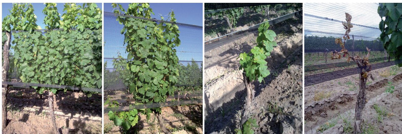
Figura 1. Fotos del nivel de daño y sintomatología (para cada foto de izquierda a derecha el grado de daño es: 0, 1, 2 y 3 respectivamente).

El índice de Green ( C_x ), debido a su poca dependencia de la densidad media y del tamaño de la muestra, es un buen indicador del patrón espacial con valores positivos indicando distribuciones contagiosas (Cabrera et al. , 2003). Otro parámetro influenciado por el tamaño de la muestra y la unidad de muestreo es el "k" de la distribución binomial negativa, pero es sensible al tipo de hábitat y al estado de desarrollo de la población. Sus valores son inversos al