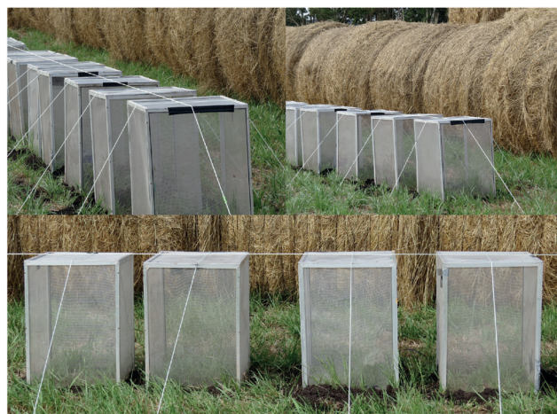
Figura 3. Jaulas de aluminio utilizadas en la experiencia.

las. Para estimar la biomasa vegetal inicial de la pastura se tomaron 5 muestras cosechando la vegetación presente en 0,25 m 2 .