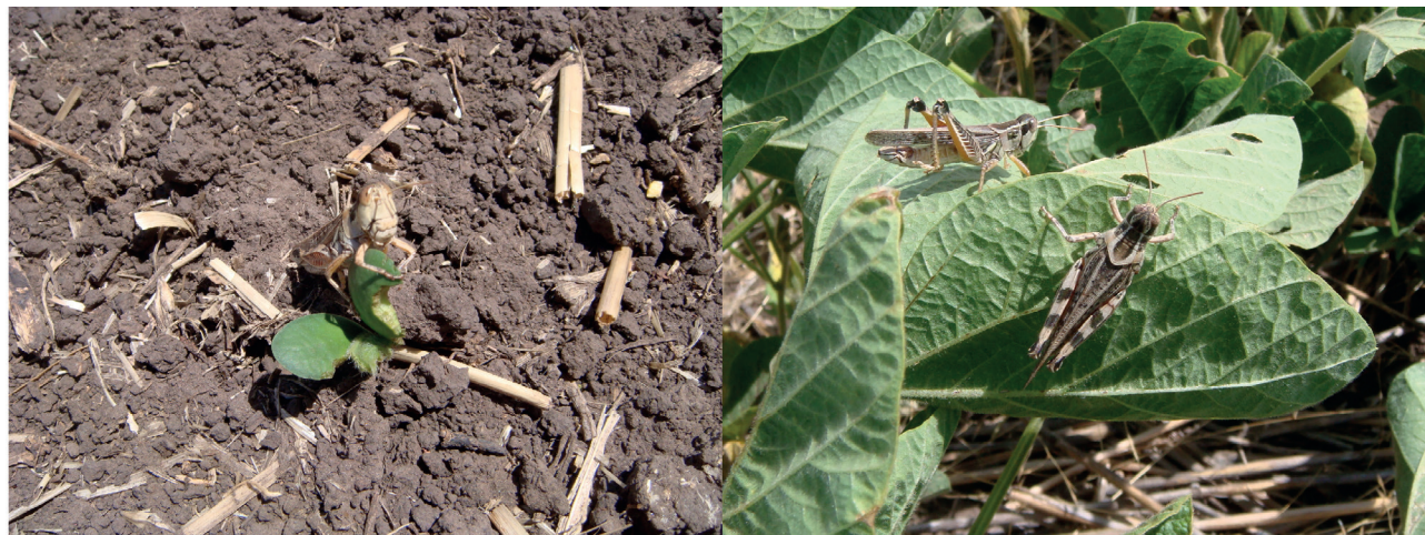
Figura 1. Individuos adultos de Dichroplus maculipennis en plantas de soja. Diciembre de 2009, Benito Juárez, provincia de Buenos Aires.

y Sánchez, 1992; Onsager, 2000; Branson, 2008). A altas densidades pueden destruir plantas enteras o grandes porciones de ellas, produciendo una disminución en la superficie fotosintética, inhibiendo la reproducción vegetativa y disminuyendo las reservas radicales (Hewitt y Onsager, 1983). En diversos estudios se ha estimado la pérdida de forraje ocasionada por diferentes especies de tucuras, determinándose que la cantidad de forraje consumido por los individuos se incrementa con los estados de desarrollo del insecto, siendo en el estado adulto cuando ocasionan la mayor pérdida (Putnam, 1962; Hewitt et al. , 1976; Hewitt, 1978; Sánchez y de Wysiecki, 1990; Bulacio et al. , 2005; Torrusio et al. , 2009; Mariottini et al. , 2011a, entre otros).