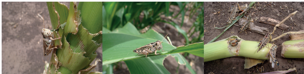
Figura 2. Individuos adultos de Dichroplus maculipennis en plantas de Maíz. Diciembre de 2009, Benito Juárez, provincia de Buenos Aires.

Además, estas investigaciones permiten tener una aproximación de las pérdidas económicas y de la disminución de la productividad de un pastizal (De Wysiecki y Sánchez., 1992; Onsager, 2000; Branson et al. , 2006).