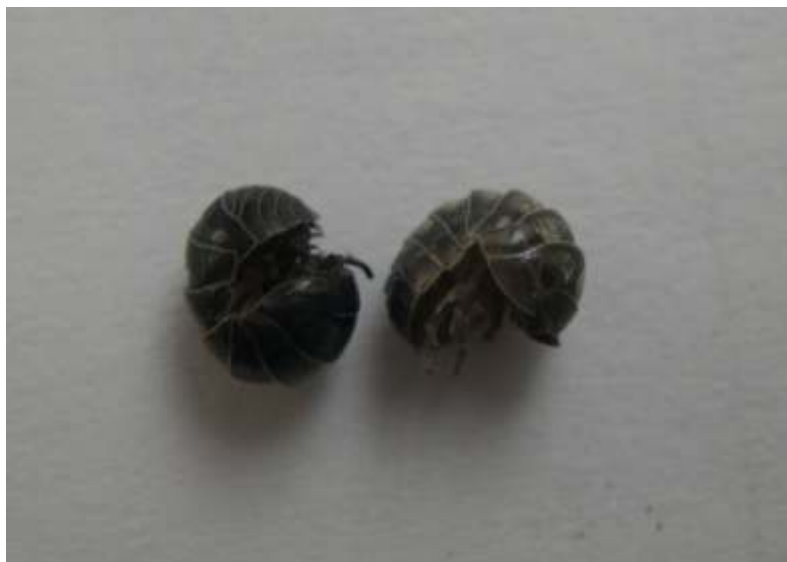
Figura 3. Adultos de Armadillidium vulgare muertos debido a la exposición de Clorpirifos y Cipermetrina.

A diferencia de lo observado en este estudio, 2880 g de i.a. Glifosato ha -1 produce mortalidad y disminución en la tasa de alimentación del isópodo Philoscia muscurom (Eijsackers, 1991). Asimismo, Bushaiba et al. (2006) observaron 55 % de mortalidad de P. scaber a los 21 DDA del herbicida. Sin embargo, hay que tener en cuenta que los efectos perjudiciales del herbicida sobre los isópodos reportados en la bibliografía son ocasionados con dosis superiores a las aplicadas en este estudio.