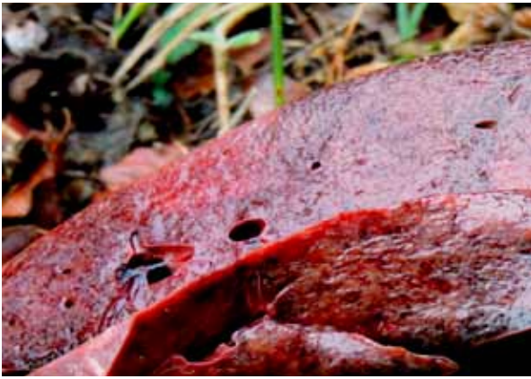
Figura 1. Al corte, el hígado reveló una acentuación del patrón lobulillar del parénquima.

una acentuación del patrón lobulillar del parénquima, con zonas pálidas intercaladas con áreas de intensa congestión (Figura 1).