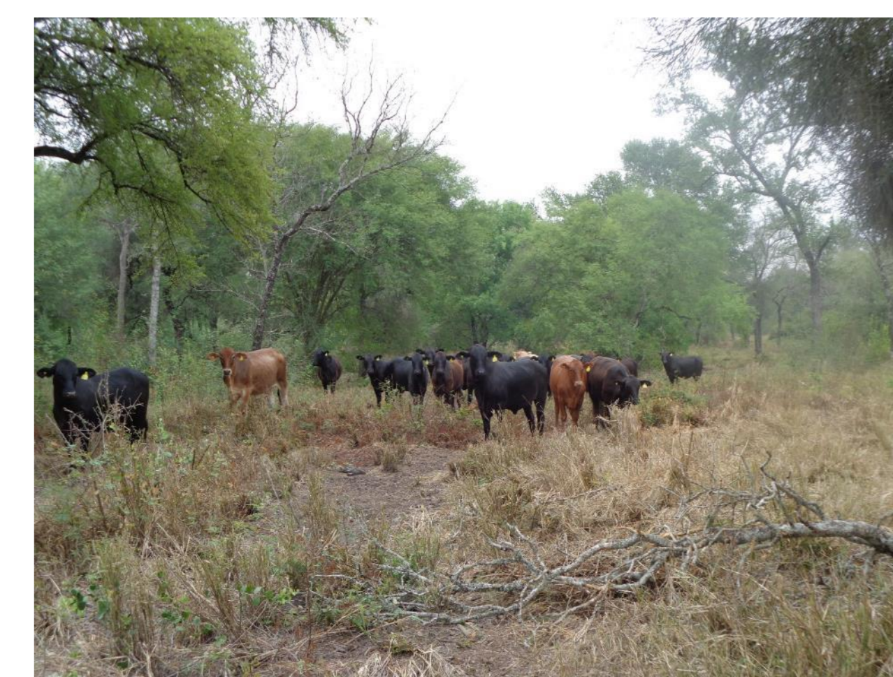
Figura 3: SSP Castelli