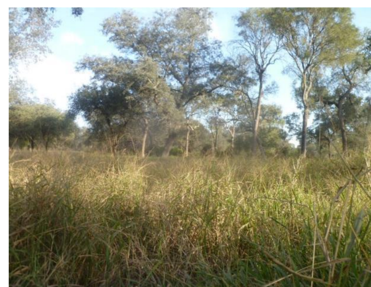
Figura 2: SSP Los Frentones

En el caso de la determinación de la actividad de la FDA no se obtuvieron diferencias significativas entre situaciones. El carbono de la biomasa microbiana en el SSP, puede ser mayor por una mayor actividad en la rizósfera, producida por las pasturas; mientras que los contenidos de glomalina, se asocian al alto número de especies, ya que el BN conserva diversidad de especies en los distintos estratos y tiene poca intervención antrópica. Además, la composición de la comunidad de plantas puede influir sobre la concentración de glomalina en el suelo, porque las raíces sirven como sitios hospederos de los hongos micorrízico arbusculares (HMA), pero el hospedante influye diferencialmente sobre las especies de HMA. En referencia a la FDA, los cambios provocados en la actividad de las enzimas no solo dependen de las variaciones de la expresión génica microbiana, sino también de factores ambientales que afectan a la actividad.