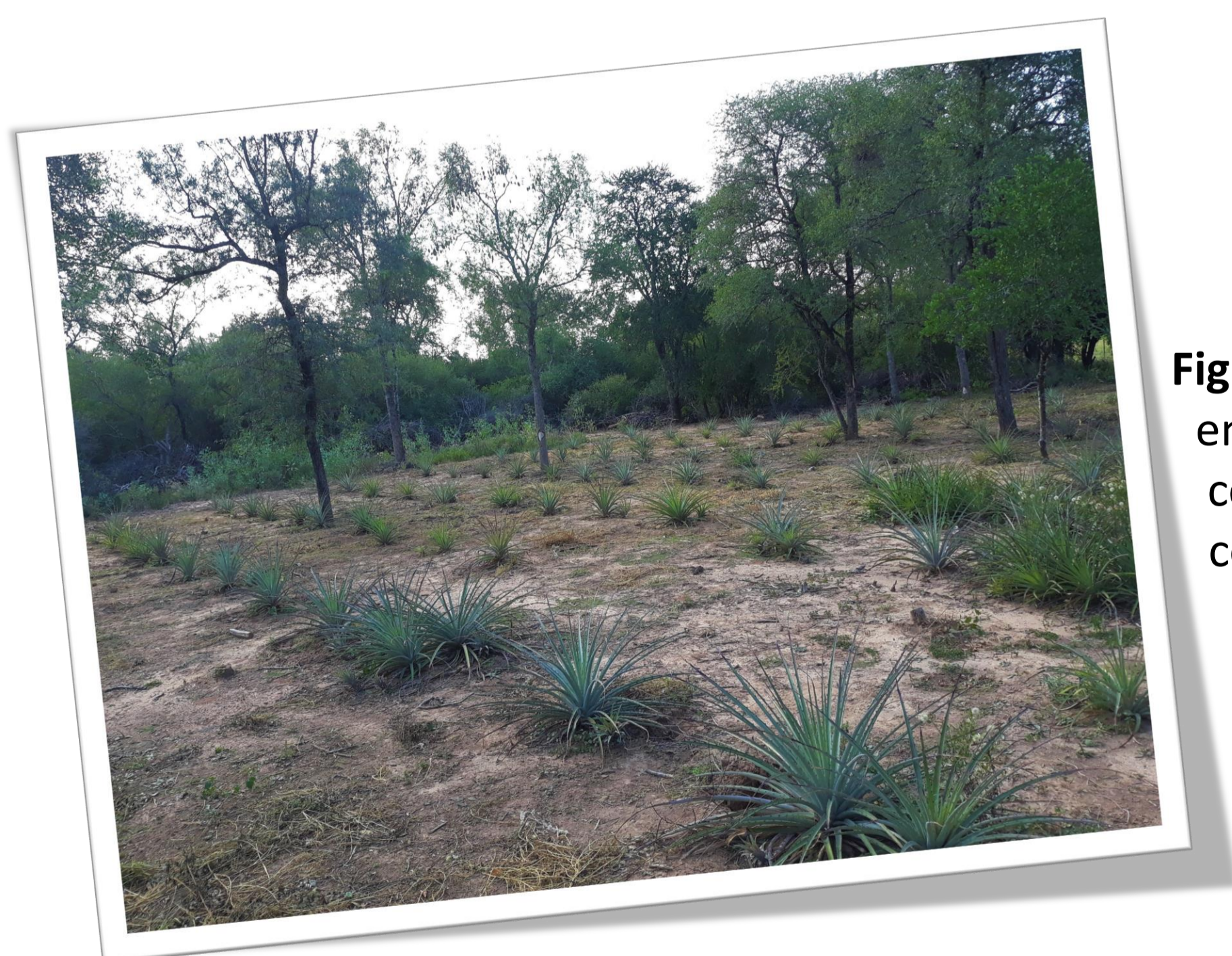
Fig. 1: Plantación de chaguar en claro del bosque nativo con 30-40% de cobertura con un marco de 3 x 2 m.

El sitio de plantación fue un claro con 30-40% de árboles en medio del bosque nativo, con un marco de 2 x 3 metros (Fig. 1). Después de cada plantación se realizó un riego de asiento y luego un riego semanal durante tres meses.