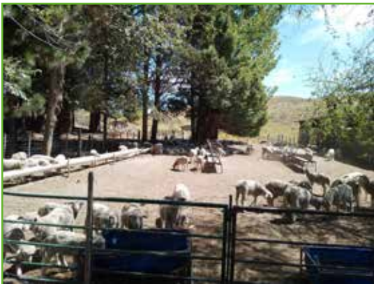
Figura 1: Corderos criados con el sistema de media leche en corrales con disponibilidad de agua, sombra y alimento balanceado, pellet y heno de alfalfa.

por la misma cantidad de pellet de alfalfa y un alimento balanceado para corderos (Alimentos Balanceados Crecer, Engorde Cordero, 20% proteína y 2,7 Mcal Energía Metabolizable) ofrecido en forma gradual a razón de 100 g/cordero hasta llegar a los 400 g/cordero. Durante los últimos 15 días de la experiencia los corderos tuvieron un período de acostumbamiento al pastoreo donde se les ofreció 300 g/animal de alimento balanceado durante la mañana y a partir del mediodía permanecieron en pastoreo en un mallín de 9 has.