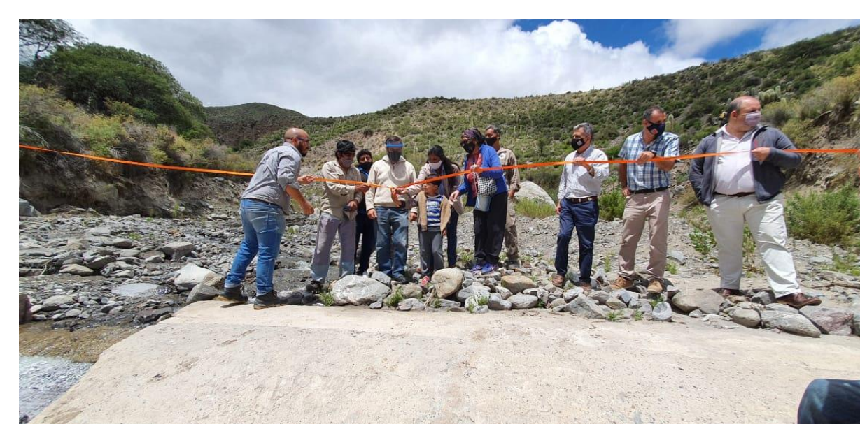
Salas - Inauguración de la obra de toma