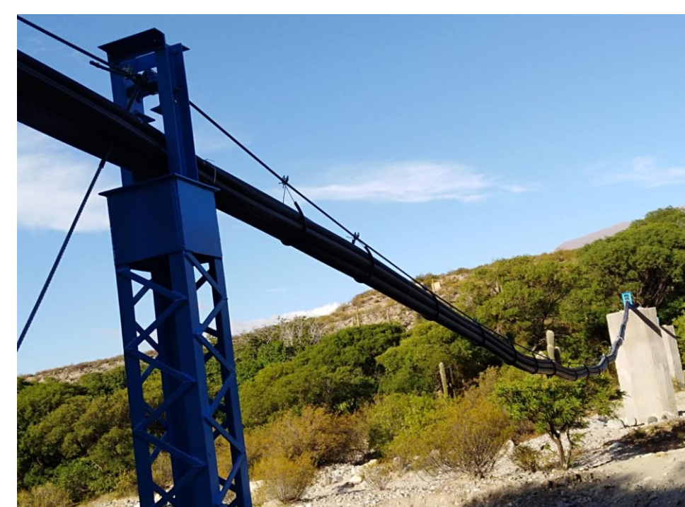
Cruce aéreo del acueducto La Fronterita

Además, a través del Proyecto MST – NOA se construyó una Sala de Agregado de Valor de productos locales y se encuentran en proceso de implementación un Centro Demostrativo de Buenas Prácticas de Manejo de Suelos y el proyecto de Reforestación en Bosque de Algarrobos de Encalilla, que tiene una gran importancia biológica y simbólica para la Comunidad.