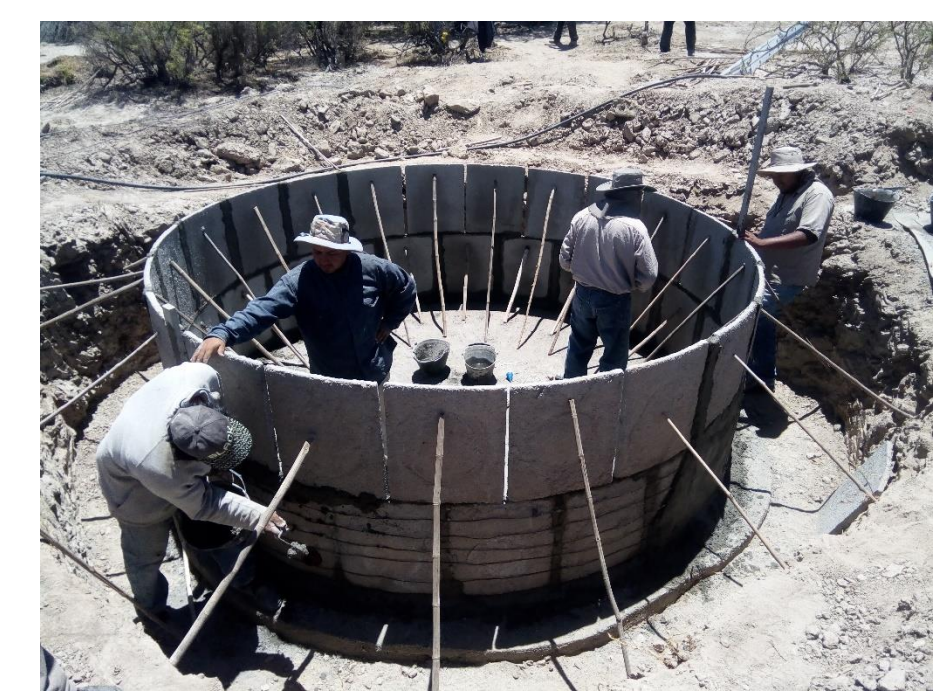
Tiu Punco – Construcción de cisterna de placas