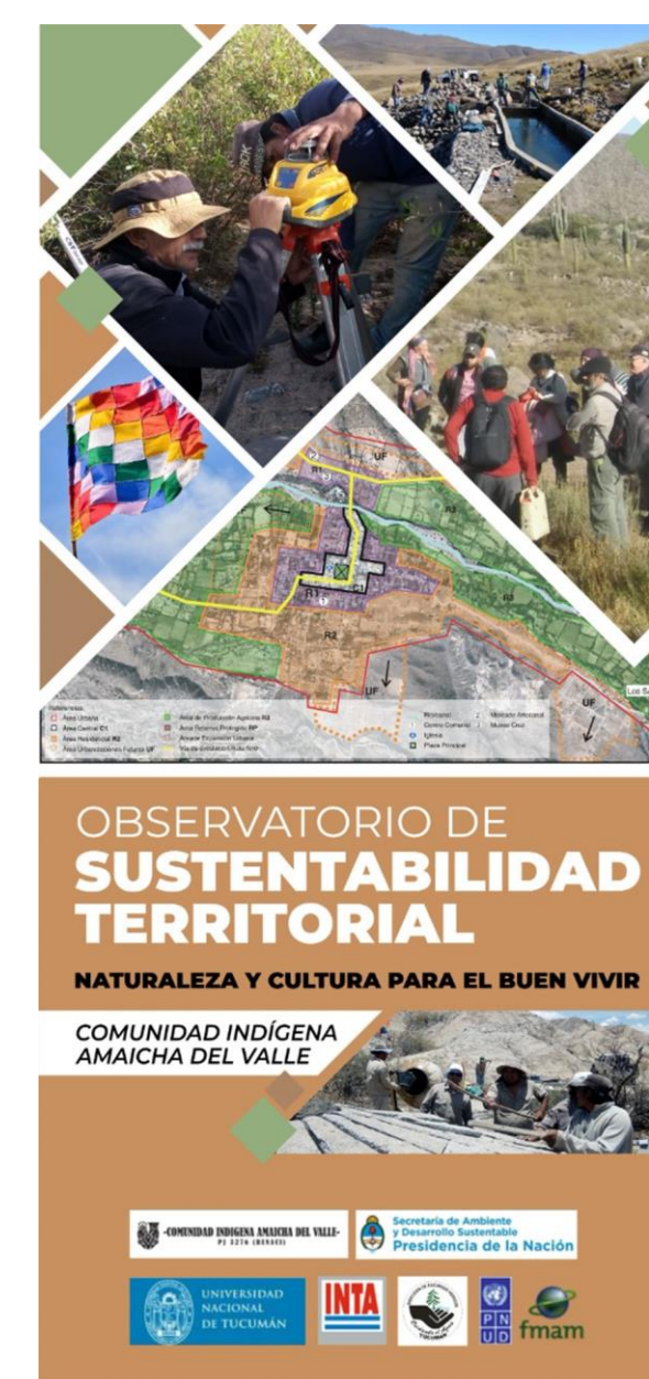
Observatorio Comunitario de Sustentabilidad Territorial