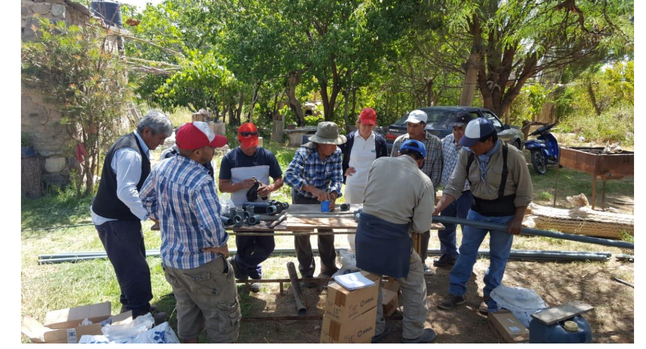
Capacitaciones para el armado de equipos de riego