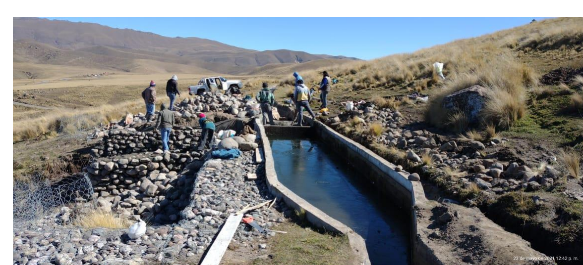
Reparación del Canal El Infiernillo

Entre 2018 y 2021, la articulación de la CIAV con el INTA, Prohuerta y MaYDS (MST NOA – Cuyo) permitió ejecutar diversos proyectos de riego presurizado para la producción agrícola y para el suministro de agua, en seis parajes del territorio amaicheño, totalizando 189 lotes de cultivo pertenecientes a 108 familias, en una superficie total de 121 ha, lo que representa un promedio de 0,64 ha por lote y 1,12 ha por familia. En el mismo marco institucional y en cooperación con el PE I 205 del INTA “Prospectiva, observatorios y ordenamiento territorial” se ejecutó el Proyecto “Gestión Integrada de los Recursos Hídricos” que contempló la rehabilitación de tres sistemas de riego y la conformación de un Observatorio de Recursos Hídricos y Sustentabilidad Territorial.