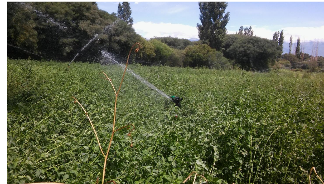
Los Zazos - Riego por aspersión

La construcción de la Bodega Comunitaria de los Amaichas y su inauguración en 2016, marcó un hecho fundacional del protagonismo de la Comunidad en el desarrollo local, impulsando el cultivo de la vid como una posibilidad de fortalecer la economía social y solidaria, obtener ingresos genuinos para los/as comuneros/as.