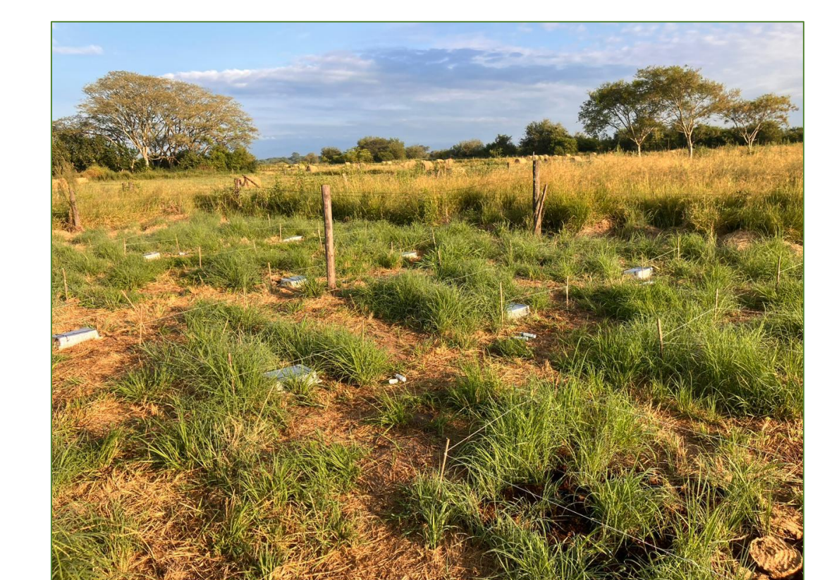
Imagen 1. Parcelas de muestreo con Chloris gayana cv Finecut