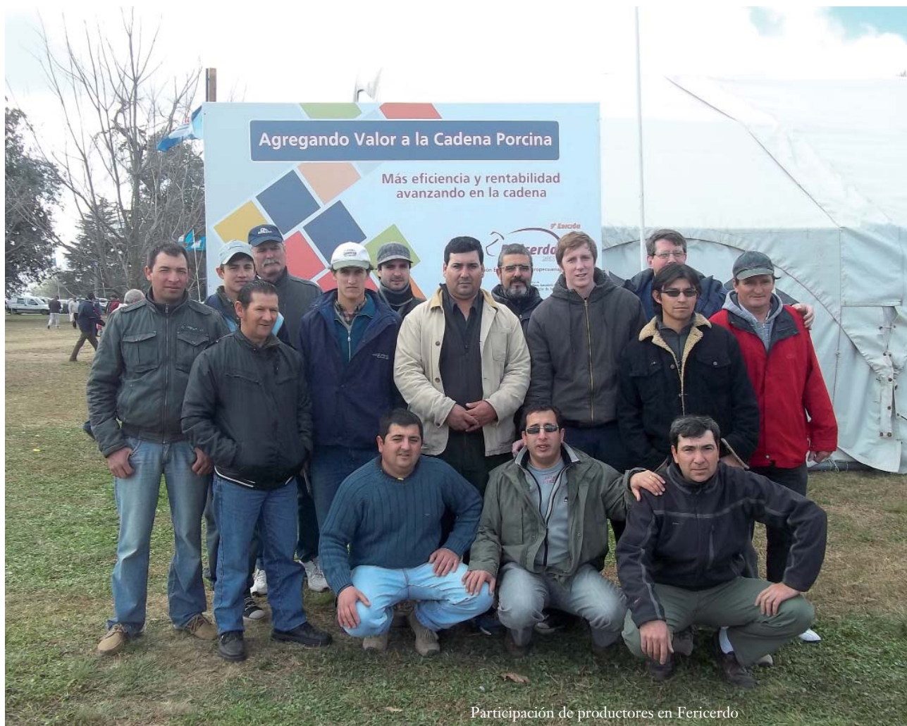
Participación de productores en Fericerdo