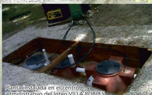
Planta instalada en el centro administrativo del loteo VILLA ROBLES Ruta Interbalnearia 11, km. 374. Partido de la Costa, Buenos Aires

Alcorta 30 4to. piso Of. 1 Neuquén Capital Tel. 0299 4472385 Cel. 0299 154384098 . 156332335 info@rvmantarios.com.ar . www.plantasailñ-co.com.ar