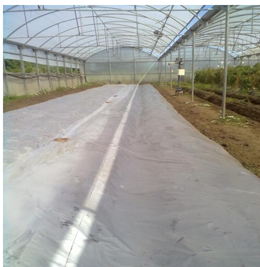
Figura 1. Suelo con incorporación de 500 g.m -2 de brócoli y estiércol (2 lomos de cada uno) humedecido y cubierto con plástico

El ensayo se condujo en octubre de 2013 en un invernáculo de la E.E. Julio Hirschhorn, FCAyF, UNLP (La Plata, 34°58' S; 57°54' W). Previo a la biofumigación, se contabilizó la nematofauna del suelo (Cap, 1991). Los tratamientos de biofumigación fueron: brócoli in situ y estiércol ex situ , incorporando en ambos casos 5000 g.m -2 (Figura 1), humedeciendo el suelo y cubriéndolo con polietileno transparente de 50 µm por 30 días. Luego, se trasplantaron los híbridos: Elpida, Lapataia, Sivinar y Yigido (2 plantas.m -2 ). En el suelo se dispuso un Datta Logger X400 con 4 sensores PT 940, a 5 cm de profundidad, calculando el porcentaje de tiempo en que la temperatura media estuvo en rangos de 0–11,6 °C; 11,7 – 23,3 °C y 23,4–35 °C. Se registró rendimiento total de las 3 primeras cosechas. El diseño fue en fajas, con 3 repeticiones y arreglo factorial 2x4. Los datos se sometieron a análisis de la varianza, evaluando las diferencias entre medias por el test de Tukey.