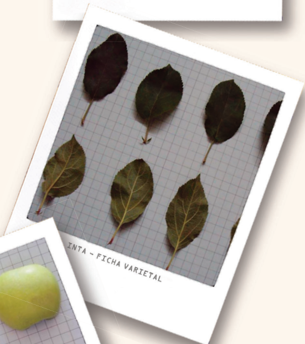
INTA - FICHA VARIETAL