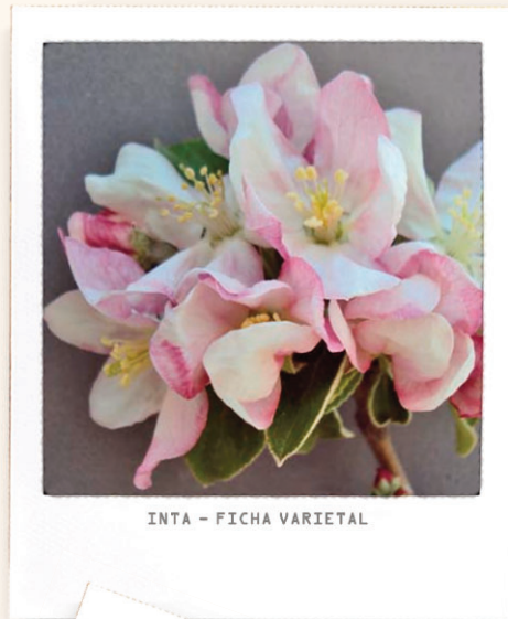
INTA - FICHA VARIETAL

El fruto es oblongo, pequeño y ligeramento. El color de la epidermis es amarillo con un porcentaje muy pequeño de tonalidad rosada. Presenta pocas lenticelas, color claro y tamaño pequeño, de distribución uniforme en el fruto. El pedúnculo se inserta en ángulo recto con el eje, de longitud y grosor mediano, color combinado. La pulpa es de color blanco.