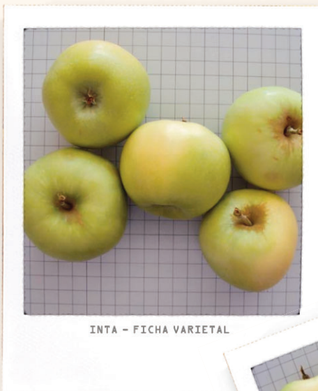
INTA - FICHA VARIETAL