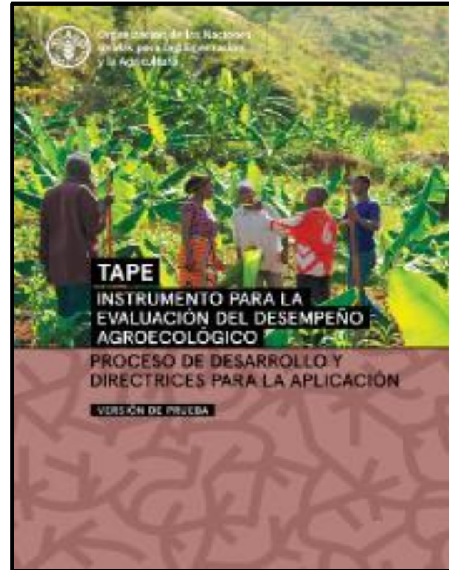
Paso 1: Diagnóstico multidimensional de los sistemas productivos.