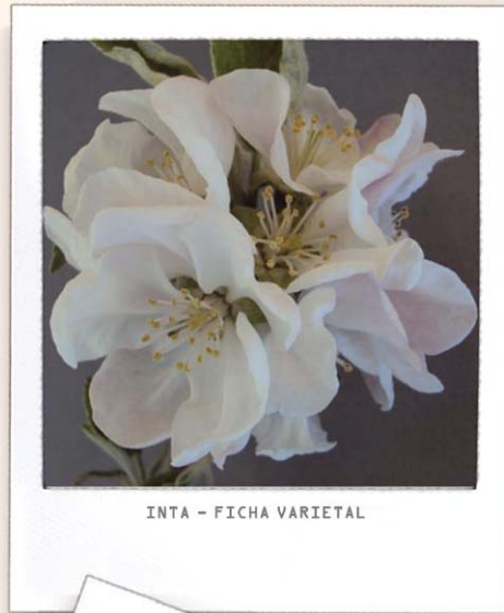
INTA - FICHA VARIETAL