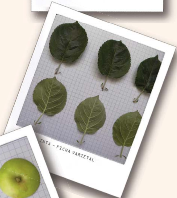
INTA - FICHA VARIETAL