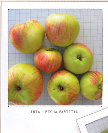
INTA - FICHA VARIETAL