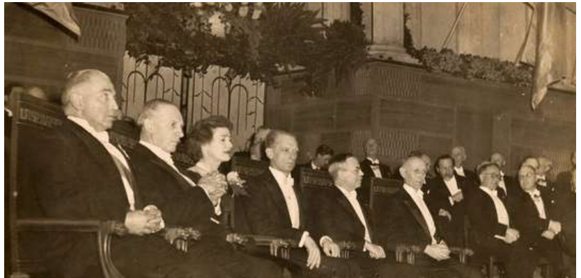
Figura 2. El Dr. Houssay en la entrega del Premio Nobel, 1947. Es el quinto de la primera fila desde la izquierda (Casa Museo Bernardo Houssay, 2020).