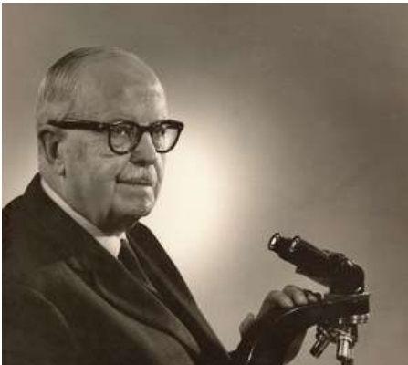
Figura 1. Dr. Bernardo Houssay, eminente científico argentino e importante figura en el desarrollo de la ciencia, y primer Premio Nobel de América Latina en ciencias (Casa Museo Bernardo Houssay, 2020).