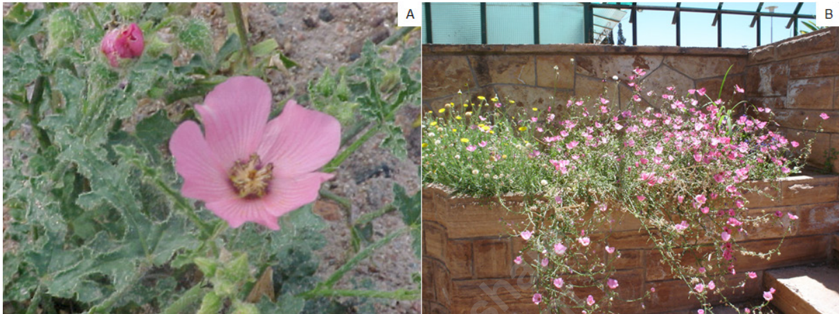
Figura 5. Lecanophora heterophylla , (A) detalle de la flor, (B), plantas en cantero en plena floración (a la izquierda del cantero, de flor amarilla, Hysterionica jasionoides ).

En ensayos de germinación, se observaron diferencias significativas entre los porcentajes de germinación según la época de recolección de frutos. La germinación es muy baja cuando los frutos maduros se recolectan a comienzos de la floración (11%), aumenta en plena floración (87%), para disminuir hacia el final de la misma (59%) (Videla et al. , 2005). La máxima germinación se alcanza cuando los frutos son recolectados en plena floración para decaer después en el otoño (Ponce, 2006).