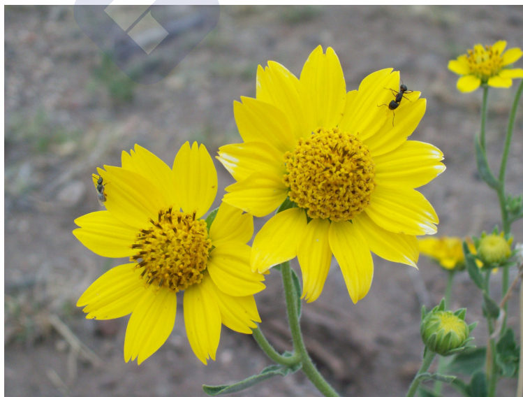
Figura 3. Verbesina encelioides , mirasolillo.

Se distribuye desde el sur de Estados Unidos hasta Argentina, Río Negro. Posee propiedades medicinales como antihemorrágica y cicatrizante. También se cita como forrajera (Figura 3).