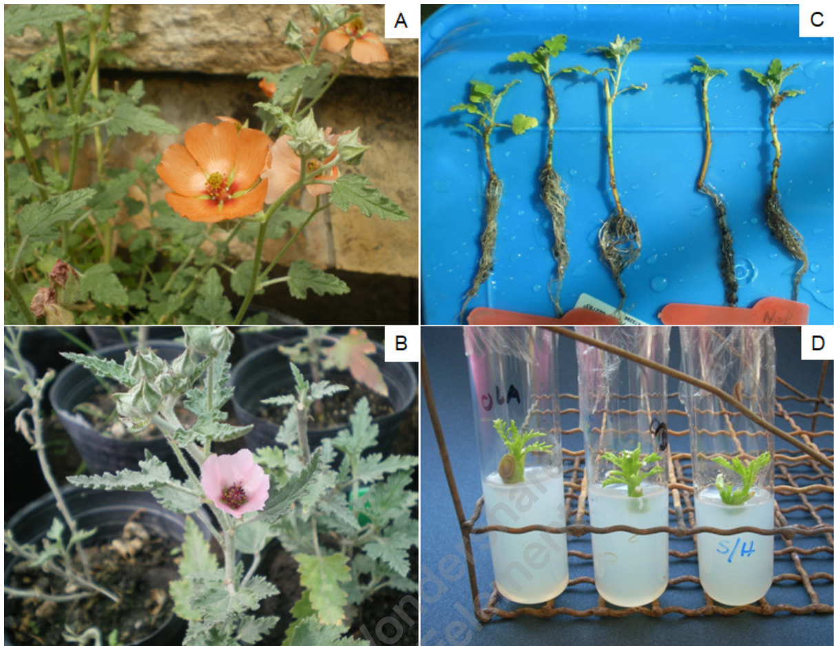
Figura 4. Sphaeralcea miniata (A) y S. mendocina (B), esquejes enraizados (C) plantas in vitro (D).

Observaciones realizadas en flores en diferentes estados de desarrollo, indican que en S. mendocina los granos de polen se liberan antes de la apertura floral y el estigma está receptivo en los pimpollos (burbujeo con peróxido de hidrógeno 40 vol. al 3%), por lo que sería posible realizar cruzamientos antes que se abra el pimpollo (Cuesta, inédito).