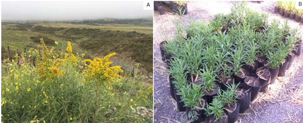
Figura 2. (A) Solidago chilensis en Las Carreras, Tupungato, Provincia de Mendoza. (B) Lote de plantas de Solidago listas para la venta.