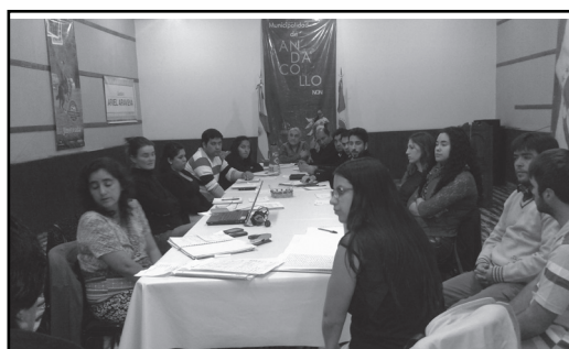
▣ Taller de trabajo.

presencia en el territorio, por lo que la Mesa de OT quedó conformada por: