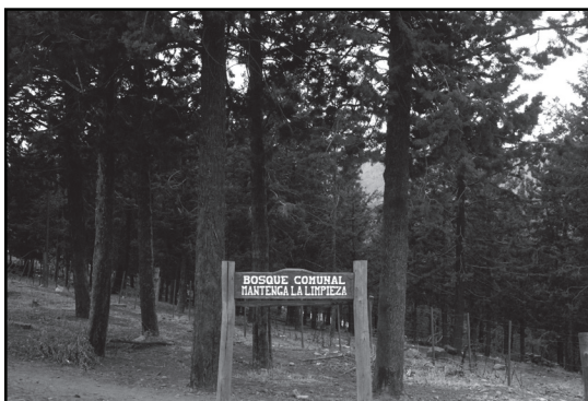
▣ Bosque comunal.

El Ejido de Andacollo se localiza en el noroeste de la provincia de Neuquén (con 370 km 2 ) y se enmarca en un ecosistema frágil de la Cuenca Alta del río Neuquén, con condiciones de semiaridez, marcadas pendientes, suelos poco desarrollados, recursos hídricos escasos y de desigual distribución, presencia de riesgos de aludes, sequías, heladas, sismos, además incluye conflictos por la tenencia de la tierra y en el uso del suelo con la actividad ganadera trashumante, con numerosos productores en tierras fiscales y problemática minera.