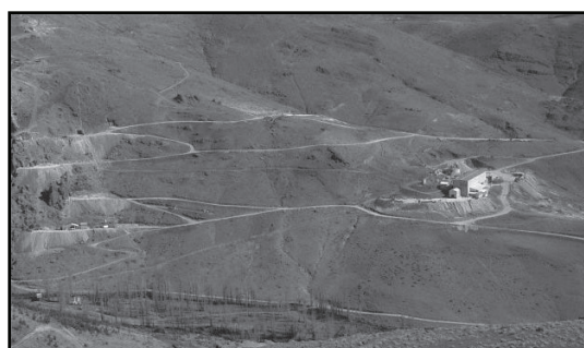
▣ Mina de oro.

la Cordillera del Viento. Las precipitaciones rondan los 700 mm, concentrándose en el invierno aunque con una alta fluctuación interanual. En este ambiente con clima templado, cálido y seco en verano y húmedo en invierno dominan las estepas arbustivas y herbáceas, con bosques relictos de cipreses. Están presentes también las plantaciones de pinos que conforman el Bosque Comunal manejado por el municipio.