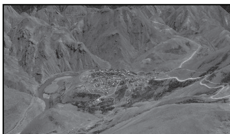
▣ Vista aérea del Municipio de Andacollo.

El proceso está liderado por el Intendente municipal y a cargo de la Mesa de Ordenamiento Territorial constituida a tal efecto. El trabajo de planificación es netamente interdisciplinario e interinstitucional, con el aporte y compromiso de las organizaciones con