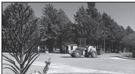
▣ Plaza principal.

y turismo dados los atractivos paisajísticos. Laboralmente la población presenta gran dependencia laboral con el Estado Provincial (64%).