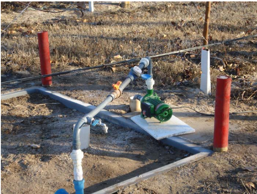
Figura 3. Equipo para extraer y tomar muestra del agua excedente