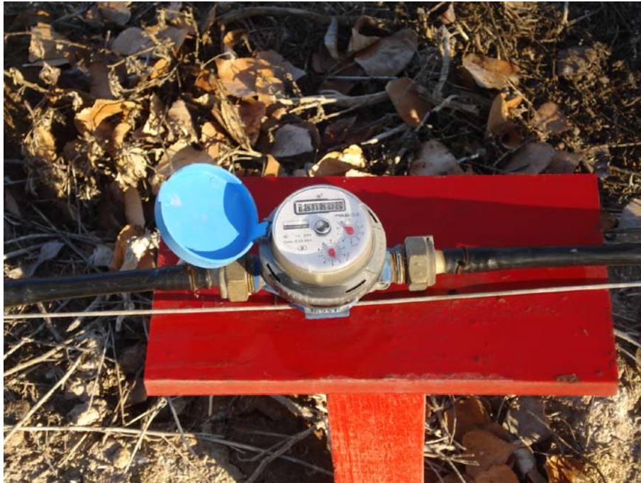
Figura 2. Instalación del medidor de agua sobre el lateral de riego

orientación, densidad de plantación, características del suelo, sistema de riego, técnicas culturales.