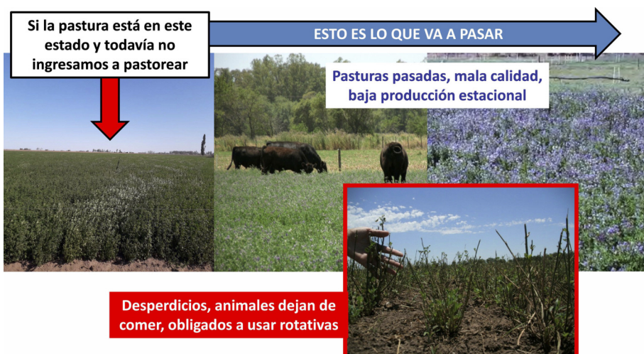
Figura 2 | Pastura de alfalfa en la que se ingresa a pastorear siguiendo las nuevas recomendaciones de manejo.