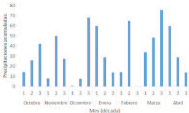
Figura 1 | Precipitaciones acumuladas por década mensual durante el ciclo del cultivo. Se observa que entre el 20 de febrero y los primeros días de marzo no se registraron precipitaciones.

etapa emergencia floración (Días E-R1) entre híbridos (D.M.S.= 3 días). Finalmente, la altura promedio fue de 211 centímetros. Los híbridos 8, 10 11 y 12, presentaron macollos sin