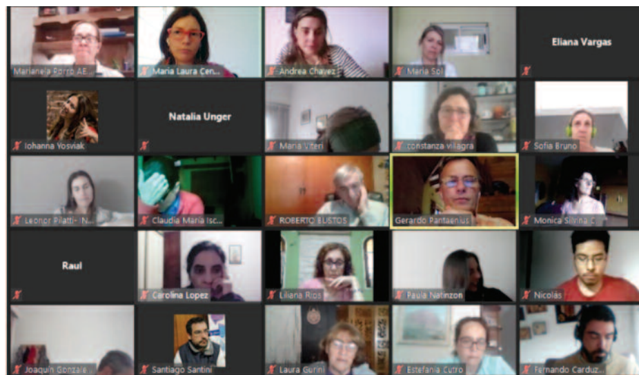
Fuente: Vivo Taller realizado vía Zoom.

Desde 2020 la Plataforma I 151 INTA brinda el Curso “Diferenciación y valorización de productos agropecuarios, alimentos y artesanías locales” donde se reflexiona sobre las calidades de los productos locales, se ponen en conocimientos distintas herramientas y estrategias para valorizarlos y se brinda información sobre metodologías para el acompañamiento de proyectos a nivel territorial.