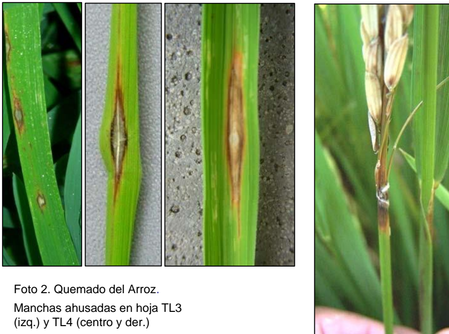
Foto 2. Quemado del Arroz. Manchas ahusadas en hoja TL3 (izq.) y TL4 (centro y der.)