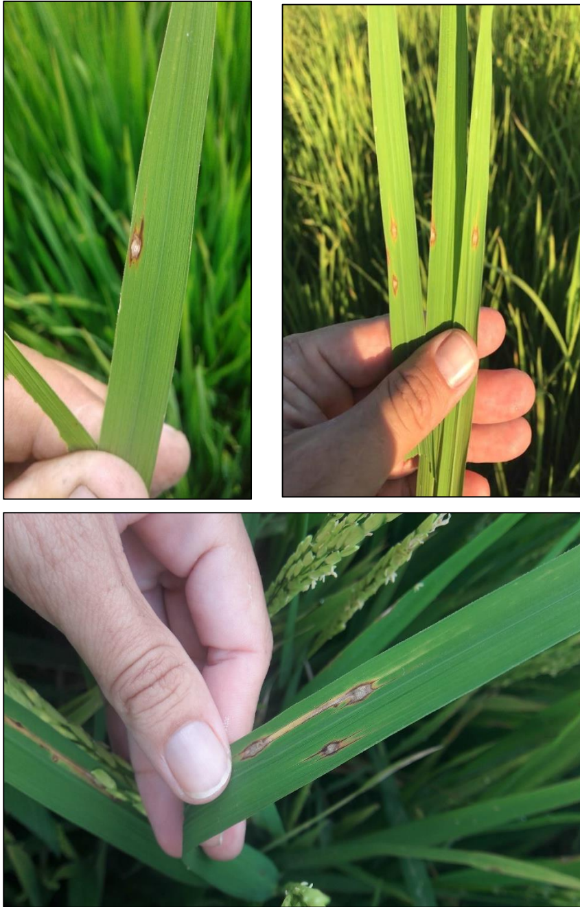
Foto 4. Manchas en hoja del cultivar Gurí INTA-CL, con TL3 de forma más redondeada que las manchas típicas, con halo necrótico formando “cuernitos” en sentido de las nervaduras. Fotos tomadas durante: A. campaña 2019/20-Conquistadores-E. Ríos (Ing. Agr. J. Ojeda); B. Campaña 2019/20-Cnia California-Sta. Fe (Ing.Agr. L. Van Opstal); y C. Campaña 2020/2021 Berón de Astrada-Corrientes (Ing. Agr. M.I. Pachecoy).