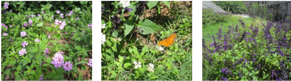
Imagen 2. Tres variedades de Sedum, Lantanas y Salvia - Fotos: MJ Leveratto, ME Vidal.

hacemos de ambos factores con nuestras intervenciones, sean estas puntuales (implantación) o generales (riego, fertilización). En el corto plazo, se producen sucesiones parciales en función del periodo de actividad de cada especie. Cuando se diseña un techo verde sustentable se procura que la comunidad de plantas elegidas no se superponga en su uso de los recursos, tanto en espacio (rastreras, globosas, cubresuelos, etc.) como en el tiempo (verano - invierno). En el mediano plazo, estos factores actuantes culminan estableciendo interacciones entre las plantas, idealmente algunas subsisten auxiliadas por sus vecinas y las que están en reposo en invierno son sustituidas temporalmente por otras propias de esa estación fría, reasumiendo su actividad cuando las últimas decaen con el verano.