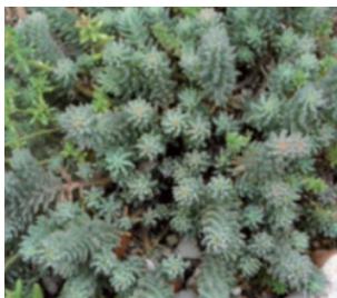
Imagen 6. Sedum reflexum , otoño.