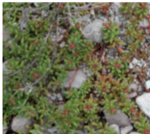
Imagen 4. Sedum album , primavera.