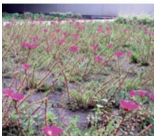
Imagen 9. Plena floración de P. gilliesii , verano.