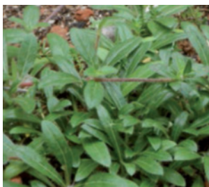
Imagen 10. Agrupación de plántulas de Gomphrena celosioides provenientes de auto - resiembra, estación primavera estival.