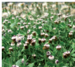
Imagen 11. Plena floración P. canescens , verano.