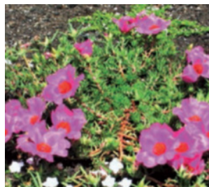
Imagen 8. Plena floración de P. grandiflora , verano.