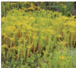
Imagen 7. Plena floración de S. mexicanum , verano.