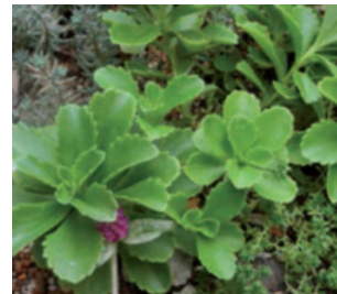
Imagen 5. S. kamschaticum en condiciones extremas de sequía, verano.