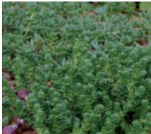
Imagen 3. Sedum acre , primavera.