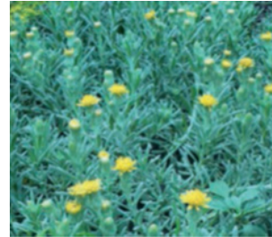
Imagen 12. Plena floración de S. ceratophylloides , verano.

Presenta una buena tasa de crecimiento aún con bajas temperaturas, es propia del período más fresco y resulta atractiva por su follaje plateado. Coloniza por estolones al abrigo de otras especies en verano cuando es vulnerable a las altas temperaturas. Es de bajo requerimiento hídrico pero no tolera condiciones extremas de sequía. Florece a fines de primavera en capítulos amarillos llamativos. Imagen 12