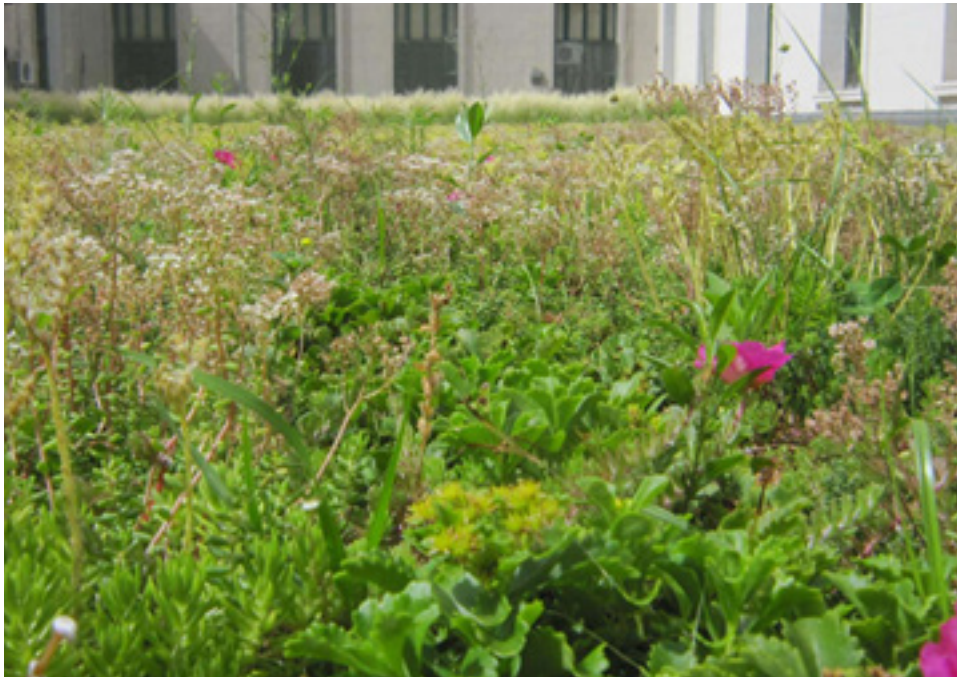
Imagen 1. Foto techo verde sustentable, con diversidad de vegetación tipo Sedum.

Tanto para el diseño paisajístico y constructivo, como para la selección de sustrato y especies vegetales deben tenerse en cuenta las características particulares del sitio y del edificio donde será instalada la cubierta verde. Es importante analizar particularmente las condiciones climáticas esperables en el lugar, incorporando estudios de asoleamiento y condiciones de viento, para seleccionar sustratos y especies vegetales que se adapten a dichas condiciones de manera natural, pudiendo así minimizar los requerimientos de riego artificial, limpieza, poda y desmalezado. Vale destacar que para el diseño y realización de una cubierta verde es un trabajo que requiere del aporte técnico de diferentes disciplinas relacionadas tanto con el diseño y construcción co-