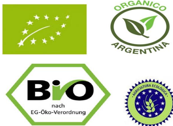
Fig. 4. Sellos que identifican productos orgánicos en Alemania, Unión Europea y Argentina.

También, otra tendencia creciente, pero en menor medida, es el agregado de valor a través de atributos vinculados a la responsabilidad social, un ejemplo es la certificación de Comercio justo (“Fair trade”), que se basa en relaciones de respeto, transparencia y equidad entre compradores y vendedores. Es común encontrar en los países desarrollados tiendas especializadas para la venta de productos certificados por la FLO-CERT, un ejemplo de ello es la empresa alemana GEPa que comercializa chocolate, café,