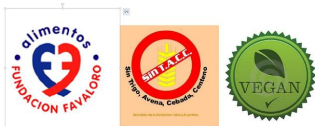
Fig. 6. Sellos que identifican productos con características particulares

Finalmente, otro atributo altamente valorado por los consumidores son aquellos productos que por sus características particulares promueven la salud o se ajustan a regímenes nutricionales especiales, por ejemplo productos sanos para el corazón, productos para celíacos, productos bajos en sodio, productos para diabéticos, productos veganos (Fig. 6).