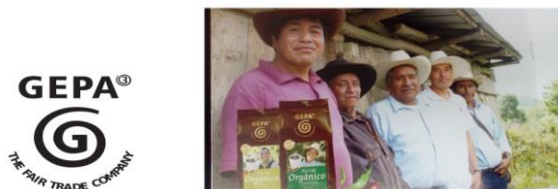
Fig.5. Sello que identifica la organización de comercio justo

Finalmente, otro atributo altamente valorado por los consumidores son aquellos productos que por sus características particulares promueven la salud o se ajustan a regímenes nutricionales especiales, por ejemplo productos sanos para el corazón, productos para celíacos, productos bajos en sodio, productos para diabéticos, productos veganos (Fig. 6).