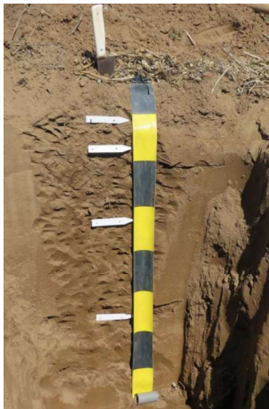
Figura 3. Calicata realizada durante el relevamiento del Dpto. Río Cuarto

Respecto a la metodología de trabajo a campo, el gran caudal de información generado por el equipo asegura la densidad de datos necesarios (calcatas, observaciones y chequeos de límites) acorde a la escala de relevamiento (figura 3). Las Cartas de Suelo son publicadas en formato digital y se encuentran disponibles on-line para su consulta de forma libre y gratuita (Figura 4).