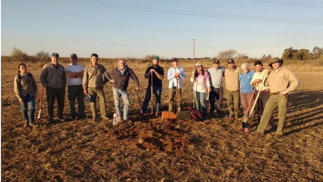
Figura 2. Parte del equipo de trabajo de relevamiento de suelos en el sur de la Provincia de Córdoba, integrado por profesionales del INTA y de la Universidad Nacional de Río Cuarto.

Respecto a la metodología de trabajo a campo, el gran caudal de información generado por el equipo asegura la densidad de datos necesarios (calcatas, observaciones y chequeos de límites) acorde a la escala de relevamiento (figura 3). Las Cartas de Suelo son publicadas en formato digital y se encuentran disponibles on-line para su consulta de forma libre y gratuita (Figura 4).