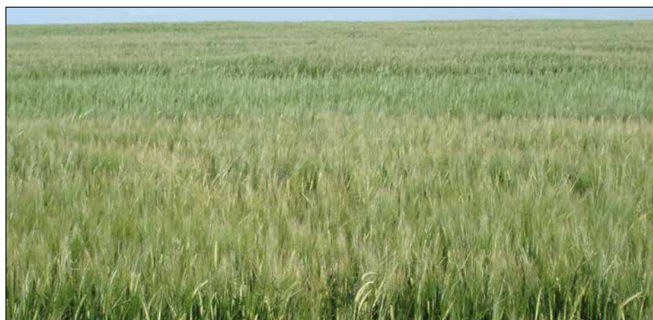
Ensayo de Fertilización de Cebada. Provincia de Buenos Aires, Argentina.