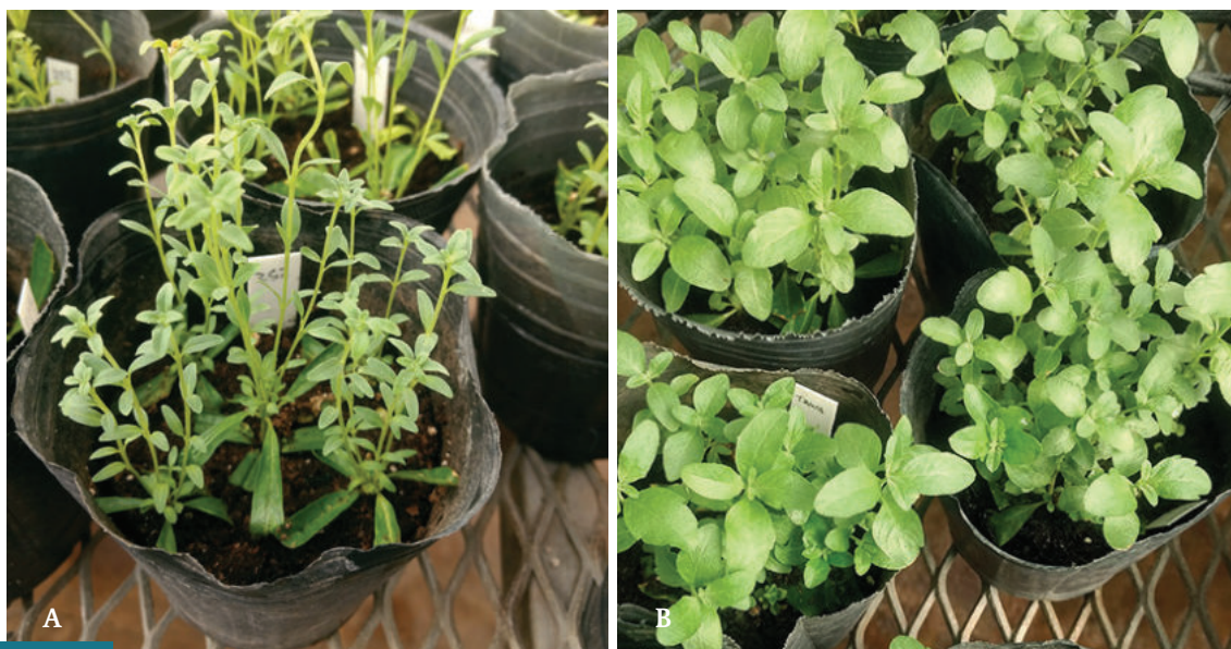
Figura 6. A. Estacas de incayuyo: quimiotipo “252” y B. variedad “TAWA INTA”, a 30 días de enraizamiento en maceta.

Se implementará un diseño con 3 repeticiones para cada localidad, a determinar. La unidad muestral estará conformada por 9 individuos como mínimo, más el borde. Para el genotipo “252” se prevé mantener el mismo marco de implantación, mientras que el “TAWA INTA” se implantará a una distancia de 0,7 m entre hileras.