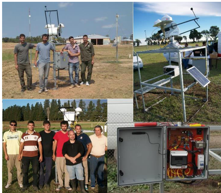
Fig. 6. Estaciones solarimétricas y grupo de trabajo INTA

Los niveles de radiación solar global sobre la superficie terrestre constituyen información importante, ya sea para dimensionar sistemas de aprovechamiento energético de la radiación solar, para estimar el rendimiento de cosechas o como parámetro de interés biológico. También es de destacar su relevancia en el análisis meteorológico, ya que las variaciones en los niveles de energía solar pueden estar relacionadas con cambios climáticos. Progresivamente se van ampliando los campos en que dicha información puede aplicarse, debido al desarrollo tecnológico o a los avances en la investigación de la interacción de la radiación con seres vivos o con la atmósfera.