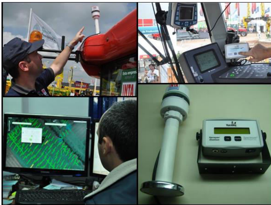
Fig. 5. Sistema de monitoreo climático y deriva en aplicaciones

El tercer desarrollo vinculado con la aplicación eficiente de agroquímicos es el sistema de monitoreo climático y deriva en aplicaciones periurbanas de agroquímicos (figura 5).