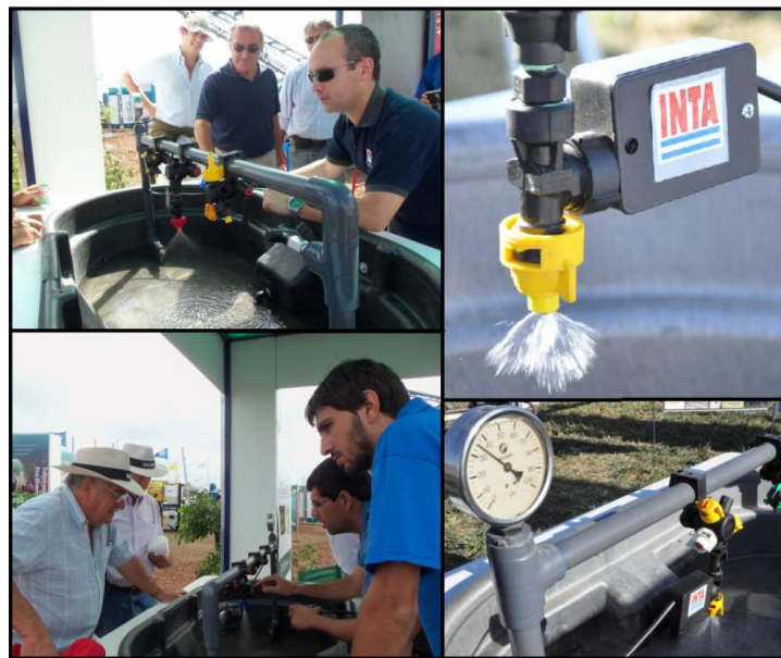
Fig. 4. Sistema de dosis variable PWM INTA

En lo concerniente a dispositivos para realizar dosis variable en pulverización existen en el mercado diversos sistemas que trabajan con diferentes técnicas. El dispositivo denominado PWM (Pulse Width Modulation) o en español, Modulación por Ancho de Pulsos, representa una solución promisoriosa debido a que permite regular el caudal sin modificar la presión de trabajo ni cambiar la pastilla en cuestión.