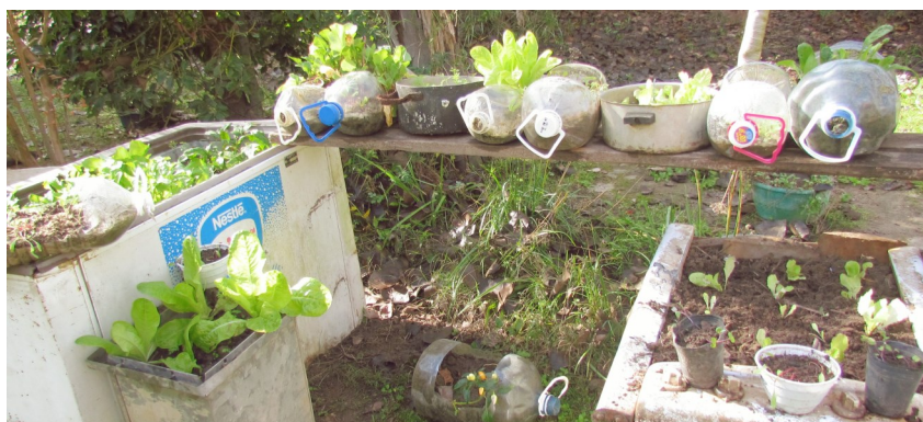
Imágenes de huertas en altura realizadas por isleños del Delta del Paraná.