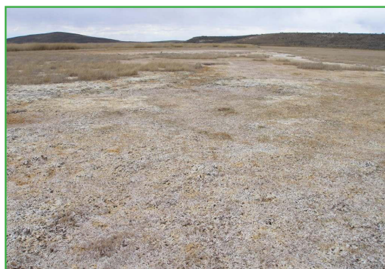
Figura 3: Mallín fuertemente salinizado por la pérdida de cobertura vegetal. Se observa eflorescencia de sales en la superficie.

Estos estudios revelaron que cambios en la cobertura del suelo, generados por un pastoreo excesivo que