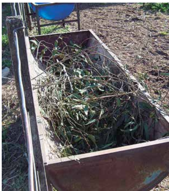
Foto 19: Ramas de Eucaliptus recién colocadas en un comedero (INTA Bordenave).

En las Fotos 19 y 20 muestran las ramas de Eucaliptus recién colocadas en los comederos y las vaquillonas Angus en pleno ensayo, respectivamente.