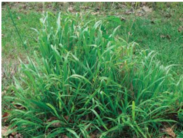
Foto 8: Panicum maximum cv Guinea likoni