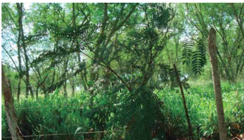
Foto 6: Leucaena ( Leucaena leucocephala )

Existen tres tipos diferentes de leucaena que desarrollan diferentes alturas: a) porte bajo 4-6 metros (tipo hawaiano o variedad-ecotipo 17489), b) porte mediano 14-16 metros (tipo salvadoreño o variedad-ecotipo 9904) y c) porte alto de 20 metros (tipo peruano o variedad-ecotipo 1774) (Ruíz et al. 2008) (Foto 6).