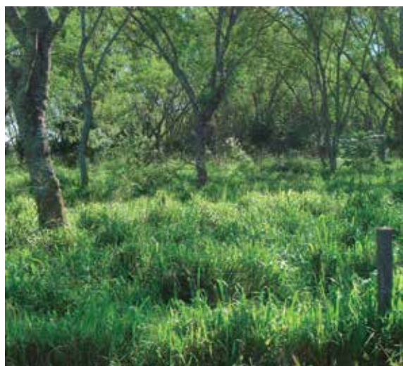
Foto 17: P. maximum likoni bajo Leucaena (I Hatuey)