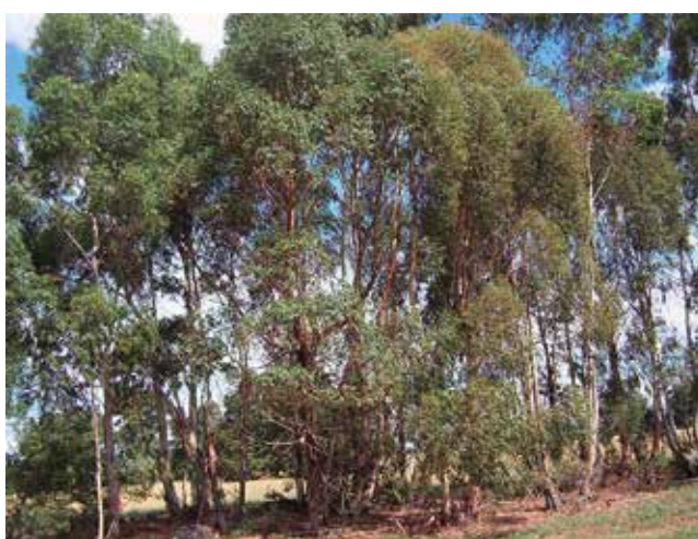
Foto 7: Eucaliptus viminalis Buenos Aires, Argentina.

Otra dificultad que ocurre en los SSP es la eliminación de las plantas invasoras. Su control es considerado crítico hasta el tiempo del cierre de las copas