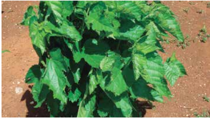
Foto 3: Morera ( Morus alba ).