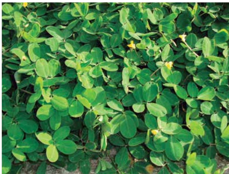
Foto 14: Maní forrajero (Arachis pintoii) Loja, Ecuador.

Es una leguminosa perenne originaria de América del Sur, principalmente de Brasil. Es una planta rastrera y estolonífera, que produce una densa capa de estolones enraizados, con entrenudos cortos y abundante semilla subterránea, que contribuye a su regeneración y persistencia. Sus hojas son de cuatro foliolos grandes, anchos y ovalados, de color verde oscuro (Foto 14).