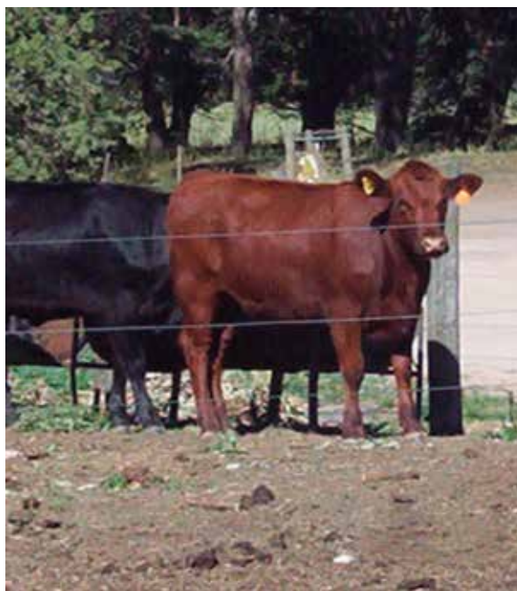
Foto 20: Vaquillonas Angus comiendo ramas de Eucaliptus (INTA Bordenave)