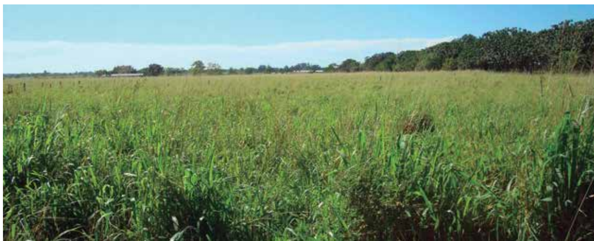
Foto 11: Panicum coloratum del Instituto de Ciencia Animal (ICA) de Cuba.