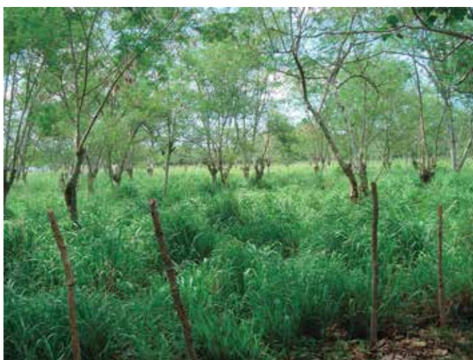
Foto 12: Guinea likoni ( P. maximum ) dentro de un SSP. Estación de Pastos y Forrajes de Indio Hatuey. Cuba

Estos autores atribuyeron ese comportamiento a la menor cantidad de radiación incidente sobre la gramínea (en esta tesis las intensidades lumínicas fueron 20.000 vs 55.500 lux, para el P. maximum cv Guinea bajo sombra y a sol pleno, respectivamente), lo que repercute en una menor actividad fotosintética.