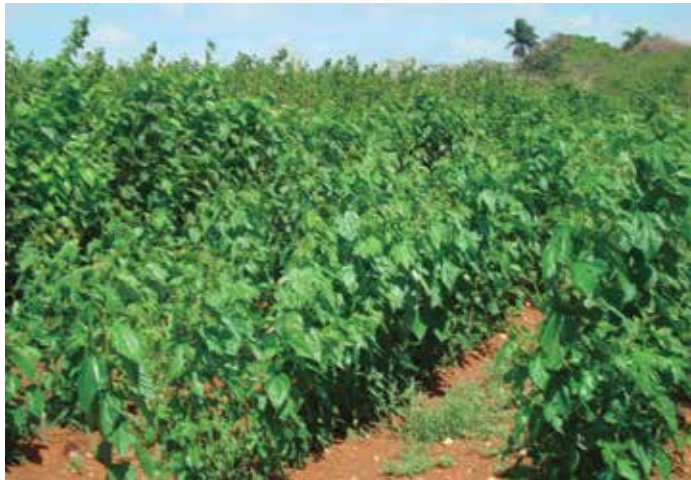
Foto 4: Morera ( Morus alba ).