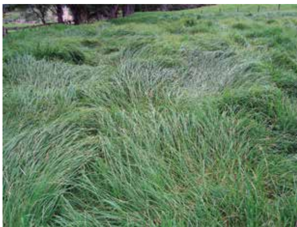
Foto 13: Pennisetum clandestinum (Kikuyo) Loja, Ecuador.

Si bien el kikuyo resiste el pastoreo conti-