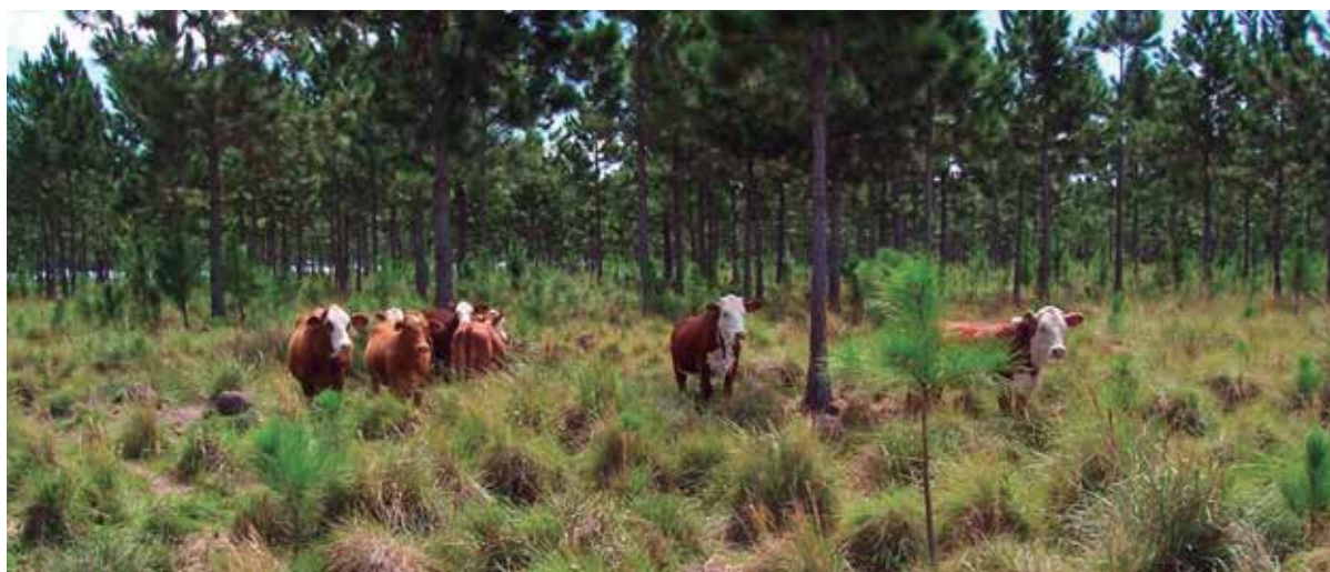
Foto 1: Sistema Silvopastoril en Corrientes.

máticos más importantes para los animales. Tajuddin (1986) reportó que la temperatura en el sotobosque bajo árboles de Hevea sp. en Malasia, pastoreado por carneros, era de 1 a 5 °C menor que a pleno sol.