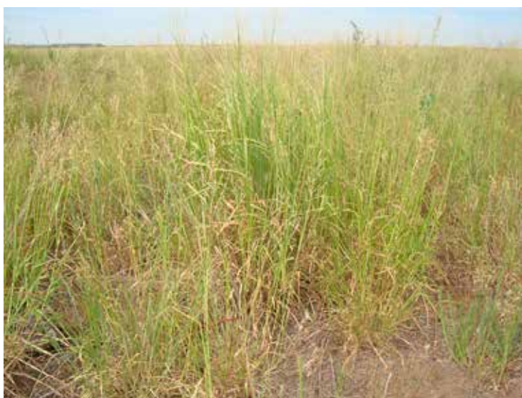
Foto 10: Panicum coloratum de la Estación Experimental de INTA Bordenave (Puán, Bs As. Argentina).

El Mijo perenne posee también una larga perennidad, se han encontrado individuos con más de 10 años. No se conocen hasta el momento plagas o enfermedades que lo afecten.