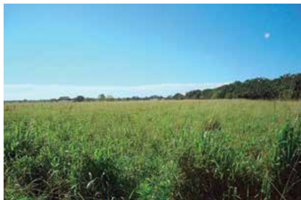
Foto 18: P. maximum cv likoni (monocultivo –ICA)

El material cosechado en los diferentes cortes (tratamientos) se pesó en el mismo lugar. Se tomó una muestra de material fresco (tal cual) de 300 g por marco y de cada corte para ser analizada en el laboratorio. Durante la fase experimental no se aplicaron fertilizantes, ni se efectuaron controles de maleza (Foto 18).