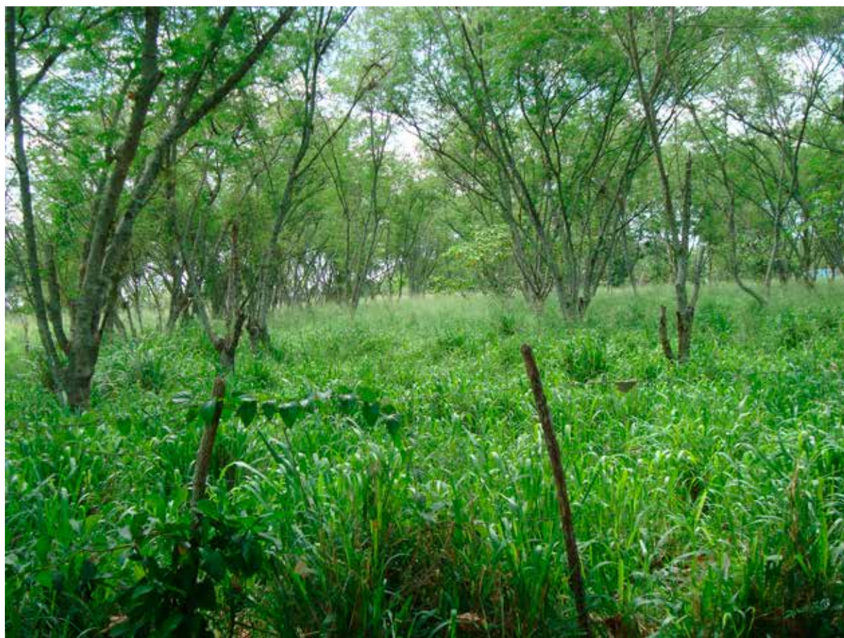
Foto 2: Sistema Silvopastoral de Leucaena leucocephala con Panicum maximum var. Likoni (Cuba).

Varios trabajos indican que el mayor efecto sobre el suelo está vinculado con los cambios en la relación suelo-agua-aire y en la proporción de K en relación al Ca y Mg, principalmente en las condiciones más intensivas de manejo (Sadeghian et al. 1999).