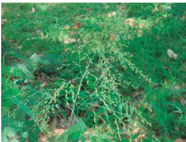
Foto 9: Panoja (inflorescencia) del P. maximum .

Presenta semilla muy pequeña, violácea a la madurez y con 1,2 a 1,8 millones de unidades por kilogramo. La producción de semilla en cada temporada es muy alta y a la madurez se despren-