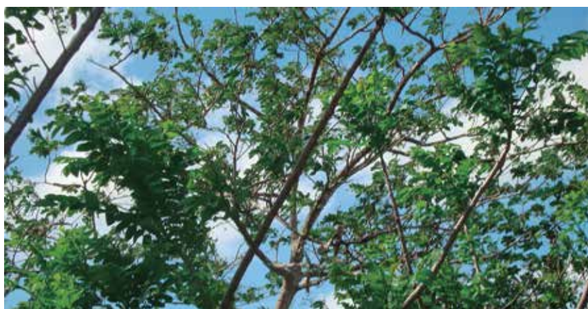
Foto 5: Mataratón ( Gliricidia sepium )

Es un árbol que necesita suelos de mediana a alta fertilidad y profundos para permitir su desarrollo radicular. No prospera en suelos ácidos, necesita pH de 5.5 – 7.