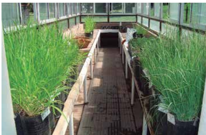
Foto 15: P. maximum cv Guinea likoni (invernadero INTA Bordenave, Buenos Aires, Argentina).

Para medir la intensidad de la energía térmica radiante o radiación térmica se utilizó un radiómetro. La unidad de medida son micromoles de fotones incidentes por unidad de superficie horizontal y unidad de tiempo ( \mu\text{mol fotones/m}^2/\text{seg} ).