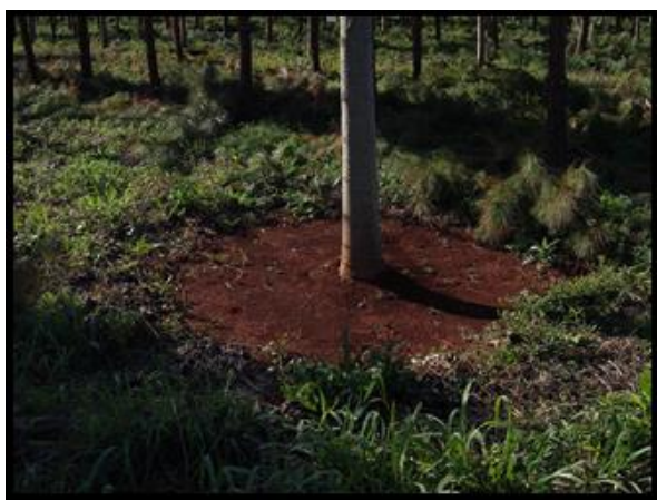
Imagen 6. Carpida para control de malezas en plantaciones de kiri en la provincia de Misiones.

daños ocasionados por fitotoxicidad son irreversibles.