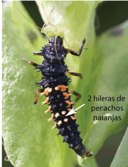
Figura 3. Larva de la VAM comiendo un pulgón, donde se resaltan las dos hileras de penachos naranjas que sirven para identificarla.