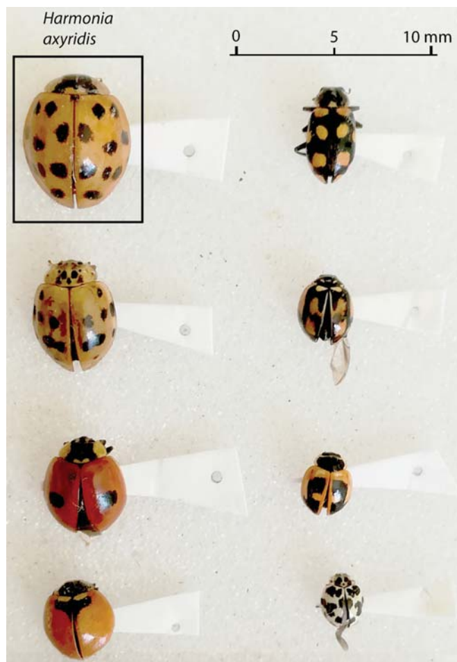
Figura 1. Tamaño relativo de Harmonia axyridis respecto de algunos coccinélidos comunes de la Patagonia. De arriba hacia abajo y de izquierda a derecha: Harmonia axyridis , Harmonia quadripunctata , Adalia bipunctata , Adalia deficiens , Eriopis connexa , Adalia angulifera Cycloneda germainii , Psyllobora picta .