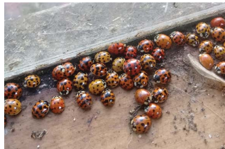
Figura 4. Agregación de individuos de la VAM en el interior de una vivienda.

produciendo daños directos o por contaminación, lo que genera pérdidas para la agricultura y la industria vitivinícola. Durante los meses de invierno la VAM forma grandes agregaciones de individuos en áreas naturales, pero también dentro de hogares (Figura 4). Esto suele causar molestias a los habitantes, y ocasionalmente se han reportado reacciones alérgicas y mordeduras. Todos estos aspectos han generado que en Europa sea considerada una de las 100 especies exóticas invasoras más dañinas.