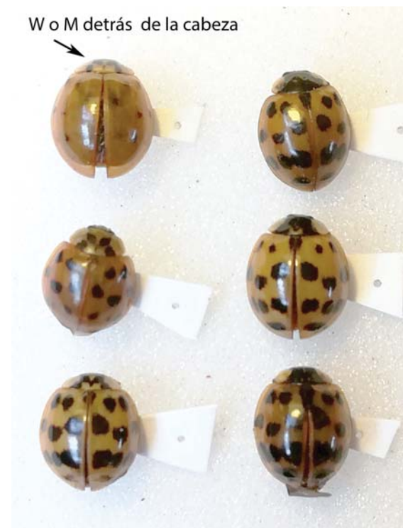
Figura 2. Distintos individuos de VAM con variación en la cantidad y grosor de las manchas y con distinto grado de definición de la W o M detrás de la cabeza.

También es posible reconocer a la VAM en estadio larval. La larva de la VAM posee grandes penachos naranjas y negros a lo largo de su cuerpo. Se diferencia de otras especies de vaquitas porque además de los penachos naranjas en los laterales, presenta cuatro penachos naranjas en la parte posterior entre medio de los laterales (dos hileras de dos penachos cada una; Figura 3).