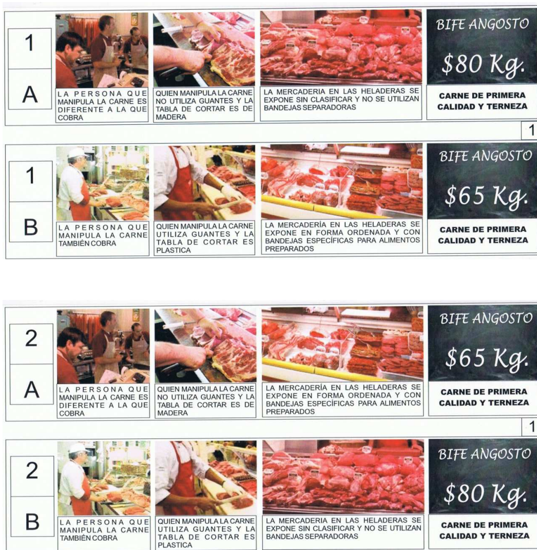
Figura 2 – Ejemplo de dos sets de elección incluidos en los CE

Las medidas de la DAP se calculan como el cociente entre dos parámetros estimados que sean estadísticamente significativos (Hensher et al. , 2005). El atributo precio se ubica en el denominador y la DAP se interpreta como la variación en el precio asociada a una unidad de variación en el atributo ( ceteris paribus ).