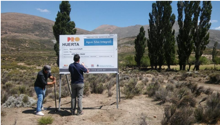
Figura 2: Proyecto Especial “Agua para Colipilli”

Técnicos de la AER Chos Malal de INTA e integrantes de la Comunidad Mapuche Huayquillan abordaron en forma conjunta la problemática de falta de agua (en cantidad y calidad) para consumo y riego en Colipilli. Se enfocaron a lograr el aumento del caudal de agua para abastecer de manera continua y segura a 21 familias, la escuela, el salón comunitario, la radio comunitaria y el puesto sanitario del paraje, aportando así a la mejora del hábitat en el ámbito rural. Se concretó mediante la elaboración y ejecución de un Proyecto Especial (PE) del Programa ProHuerta denominado “Agua para Colipilli”(Figura 2).