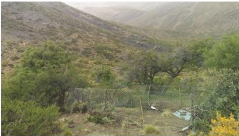
Figura 4: Detalle del cierre perimetral de la vertiente

La estructura construida permite aislar el agua de posibles fuentes de contaminación con agentes patógenos que pueden generar enfermedades en la población. Es decir que evita que animales domésticos y silvestres entren en contacto con el agua y la contaminen. Además, el sistema de captación está cerrado perimetralmente con alambre tejido, impidiendo el acceso de animales que puedan provocar roturas de estructuras, canillas y mangueras (Figura 4).