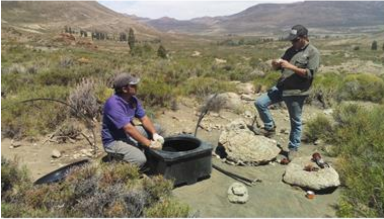
Figura 5: Armado del sistema de conducción de agua.

2.700 litros cada uno, y desde allí se distribuye el agua a los hogares (Figura 5).