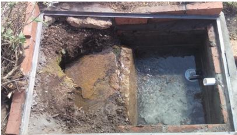
Figura 3: Obra de captación de vertiente.

Es un sistema ecológico que permite que gran parte del agua que aflora siga su curso natural, alimentando vegetación de mallines. Sólo una parte del caudal producido por la vertiente es captado y orientado al sistema de conducción (Figura 3).