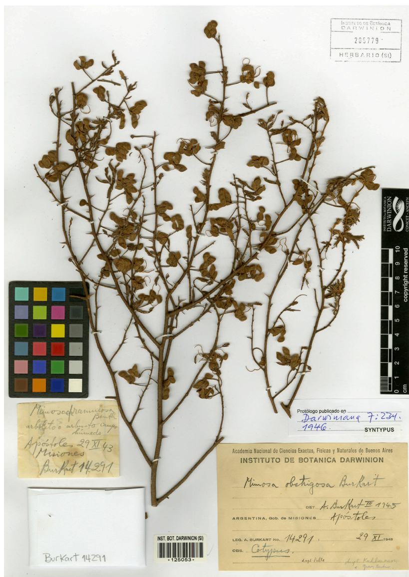
Fig. 1. Lectotipo de M. obstrigosa . Espécimen A. Burkart 14291 (SI).

Gutiérrez et al. (2002) no citaron los especímenes que había mencionado Burkart (1948), sino que hallaron en herbario y consideraron como holotipo de la especie a “ Spegazzini 3155 (LP 12568)”, basándose en que posee una diagnosis manuscrita. Sin embargo, esto no sería correcto; al describir M. tandilensis , el Dr. Spegazzini no se habría basado únicamente en el espécimen LPS12568, debido a que: 1) éste consiste en una rama estéril, y usando exclusivamente este material no habría podido