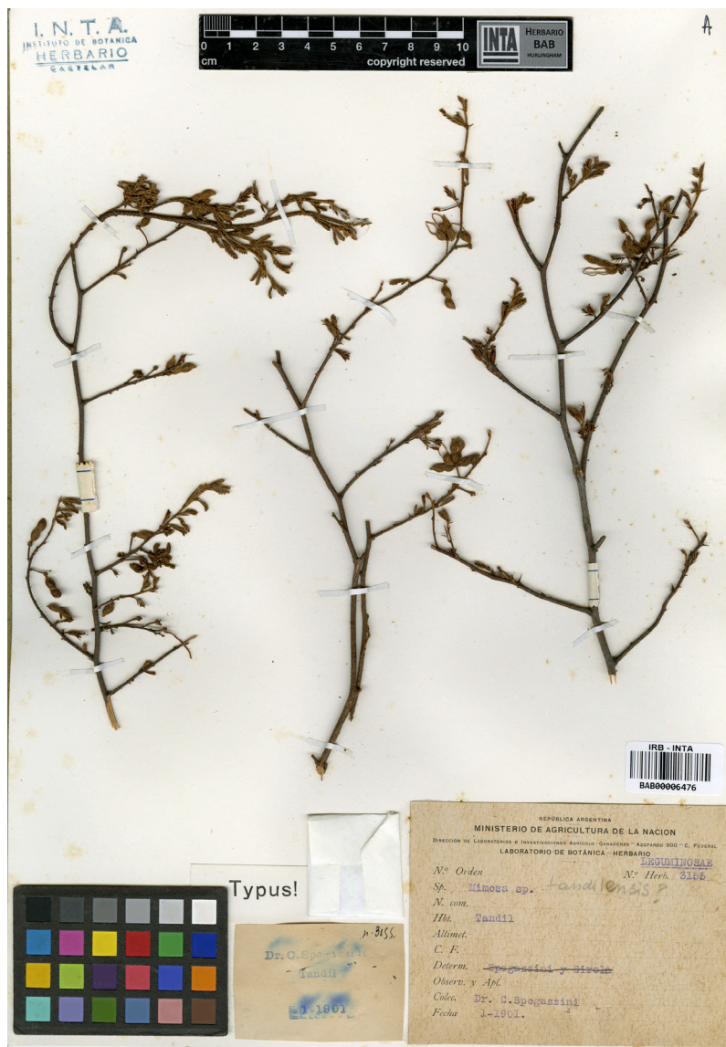
Fig. 2. Lectotipo de M. tandilensis . Espécimen Spegazzini s.n. (BAB 3155A).

Internacional de Nomenclatura para Algas, Hongos y Plantas (McNeill et al. , 2012) en su artículo 9.11, cuando no se indica específicamente el material tipo en la publicación original, sólo debe considerarse que hay un holotipo si exclusivamente se ha analizado un solo espécimen. Sólo podría asegurarse que hay holotipo si se indica particularmente un herbario en el protólogo (y si únicamente un duplicado del espécimen fue depositado allí) o si se aclaró en la publicación (o hay evidencia firme) que únicamente